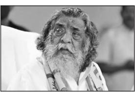
दी। दोनों ही सोमवार को दिल्ली खाना हो गये हैं। गौरतलब है कि शिबू सोरेन