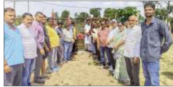
लोकतंत्र की आवाज

ब्यूरो चीफ हजारीबाग (झारखंड)। हजारीबाग और गिरिडीह जिले पर के अवस्थित विष्णुगढ प्रखंड का अलपिटो पंचायत दोनो जिलों का मध्य भाग में पडता है जहां के ग्रामीणों को आवागमन का सुलभ रोड भी नसीब नहीं हो पाया है। बताया जाता है कि अलपिटो पंचायत बहुत ही विस्तार व घनी आबादी वाला पंचायत है। इस पंचायत के ग्रामिणों का यह खुशनासीबी है कि पंचायत के कुछ गाँव बगोदर विधानसभा में कुछ गाँव माँदू विधानसभा में पड़ते हैं। इसी प्रकार लोकसभा में भी कोडरमा व हजारीबाग में पड़ते हैं। संयोग से इलाके के चारो प्रतिनिधि विधायक व सांसद चुनावी अभियान के पुरजोर आंकड़े में बाजी मारी मतदाताओं ने इनके वायदों पर भरोसा कर एनडीए समर्थित उम्मीदवारों को जितवाया। यहाँ के चारों एनडीए समर्थित चुनाव जीते है चुनाव के पूर्व चुनावी