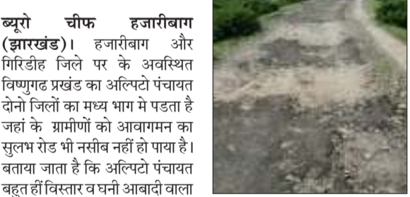
लोकतंत्र की आवाज

ब्यूरो चीफ हजारीबाग (झारखंड)। हजारीबाग और गिरिडीह जिले पर के अवस्थित विष्णुगढ प्रखंड का अलपिटो पंचायत दोनो जिलों का मध्य भाग में पडता है जहां के ग्रामीणों को आवागमन का सुलभ रोड भी नसीब नहीं हो पाया है। बताया जाता है कि अलपिटो पंचायत बहुत ही विस्तार व घनी आबादी वाला पंचायत है। इस पंचायत के ग्रामिणों का यह खुशनासीबी है कि पंचायत के कुछ गाँव बगोदर विधानसभा में कुछ गाँव माँदू विधानसभा में पड़ते हैं। इसी प्रकार लोकसभा में भी कोडरमा व हजारीबाग में पड़ते हैं। संयोग से इलाके के चारो प्रतिनिधि विधायक व सांसद चुनावी अभियान के पुरजोर आंकड़े में बाजी मारी मतदाताओं ने इनके वायदों पर भरोसा कर एनडीए समर्थित उम्मीदवारों को जितवाया। यहाँ के चारों एनडीए समर्थित चुनाव जीते है चुनाव के पूर्व चुनावी