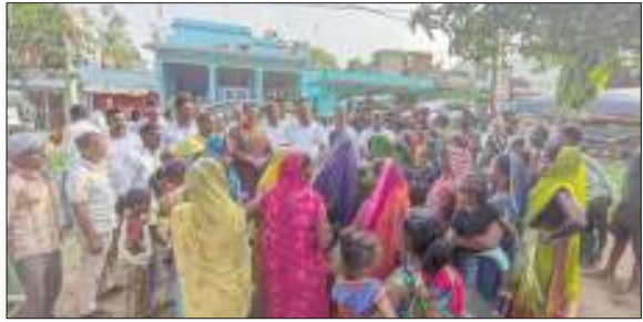
लोकतंत्र की आवाज

ब्यूरोचीफ हजारीबाग (झारखंड)। भारत के प्रधानमंत्री नरेंद्र मोदी की लगातार सबसे लंबे समय तक पीएम बने रहने और उनके कार्यकाल के सफल 12 वर्ष पूर्ण होने के उपलक्ष्य में भाजपा के संगठनात्मक कार्यक्रम के तहत हजारीबाग के सांसद मनीष जायसवाल ने मंगलवार से क्षेत्र में विशेष प्रवास कार्यक्रम की शुरुआत की। इस अभियान का मुख्य उद्देश्य पीएम मोदी के राष्ट्रहित और जनकल्याणकारी कार्यों को जन-जन तक पहुंचाना है। मंगलवार को सांसद मनीष जायसवाल ने हजारीबाग सदर विधानसभा क्षेत्र के नगर पूर्वी, सदर पश्चिम और पूर्वी मंडल के विभिन्न वार्डों व एक दर्जन से अधिक गांवों का अहले सुबह से लेकर दर रात तक दौरा किया। इस दौरान उन्होंने डेढ़ दर्जन विशिष्ट जनों के आवास पर जाकर सैकड़ों प्रबुद्ध नागरिकों और सामाजिक कार्यकर्ताओं से सीधा संवाद स्थापित किया।