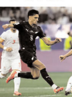
फीफा वर्ल्ड कप के इतिहास में कनेवल दूसरा बार हुआ है, इससे पहले एसी घटना 68 साल पहले 1958 में खोईउन में हुए टूर्नामेंट में देखने को मिला था, जब 15 जून के दिन खेले गए चार मैच ड्रॉ पर समाप्त हुए थे, इन मैच का नतीजा नीचे देखा सकता है।

लॉस एंजिल्स (एजेंसी)। फीफा वर्ल्ड कप 2026 के पांचवें दिन का आखिरी मैच इरान और न्यूजीलैंड के बीच खेला गया। लॉस एंजिल्स स्टेडियम में हुए त क ना ये रोमांचक मैच 2-2 से ड्रॉ पर समाप्त हुआ। जिससे दोनों टीमों को एक-एक अंक शेर्य करना पड़ा। यह मैच न केवल मैनदान पर रोमांचक खेल के लिए यादगार रहेगा, बल्कि फीफा वर्ल्ड कप 2026 के पांचवें दिन खेले जाने वाले आखिरी मैच के तौर पर इतिहास में भी दर्ज करा जाएगा, क्योंकि जो दिन का चौथा ड्रॉ मैच था, जिसके साथ टूर्नामेंट के अंतिम मैच में एक दिन में चार मैच ड्रॉ होने का अनोखा रिकॉर्ड बन गया। ऐसा