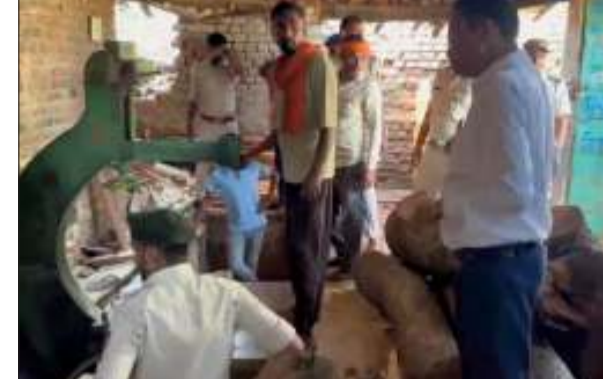
लोकतंत्र की आवाज