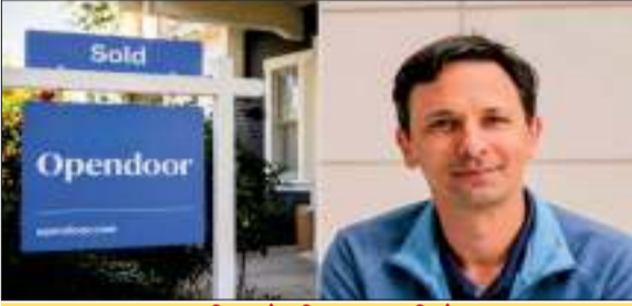
AI तकनीक ने छीना इंसानी रोजगार