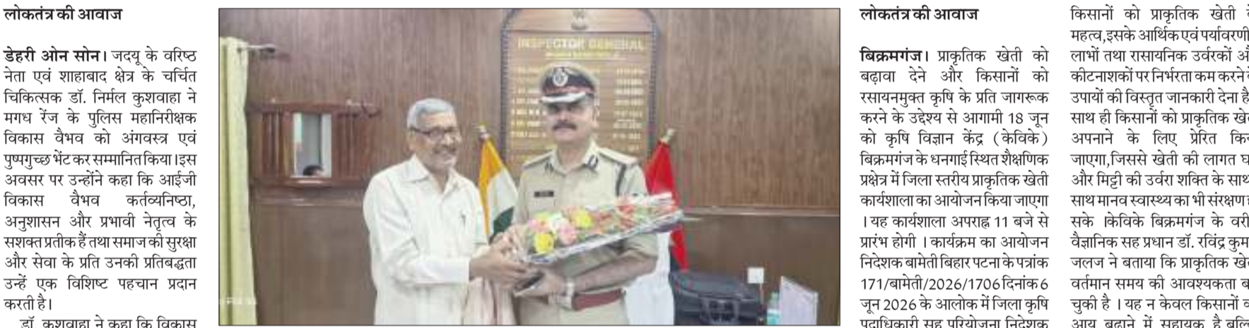
लोकतंत्र की आवाज