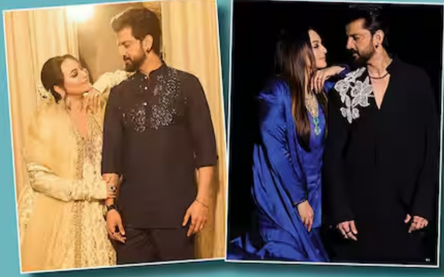
सिलसिला शुरू हुआ और फिर धीरे-धीरे उनकी दोस्ती प्यार में बदल गई। सोनाक्षी को जहीर से पहली मुलाकात में ही प्यार हो गया था।

सोनाक्षी सिन्हा और जहीर इकबाल बॉलीवुड के वयुट और बेस्ट कपल की लिस्ट में शुमार हैं। दोनों की केमिस्ट्री को फैंस खूब पसंद करते हैं और उनकी जोड़ी अक्सर सोशल मीडिया पर छाई रहती है। सोनाक्षी ने 23 जून 2024 को जहीर के साथ शादी की थी। दोनों लंबे समय से एक दूसरे को डेट कर रहे थे। खास बात ये है कि उनकी लव स्टोरी किसी फिल्मी कहानी से कम नहीं है। सोनाक्षी सिन्हा और जहीर इकबाल की पहली मुलाकात सलमान खान की पार्टी में हुई थी। यहीं पहली बार दोनों मिले और उनकी दोस्ती हुई। सोनाक्षी सिन्हा और जहीर इकबाल की पहली मुलाकात सलमान खान की पार्टी में हुई थी। यहीं पहली बार दोनों मिले और उनकी दोस्ती हुई। इसके बाद दोनों के बीच मुलाकातों का सिलसिला शुरू हुआ और फिर धीरे-धीरे उनकी दोस्ती प्यार में बदल गई। सोनाक्षी को जहीर से पहली मुलाकात में ही प्यार हो गया था। इसके बाद दोनों के बीच मुलाकातों का