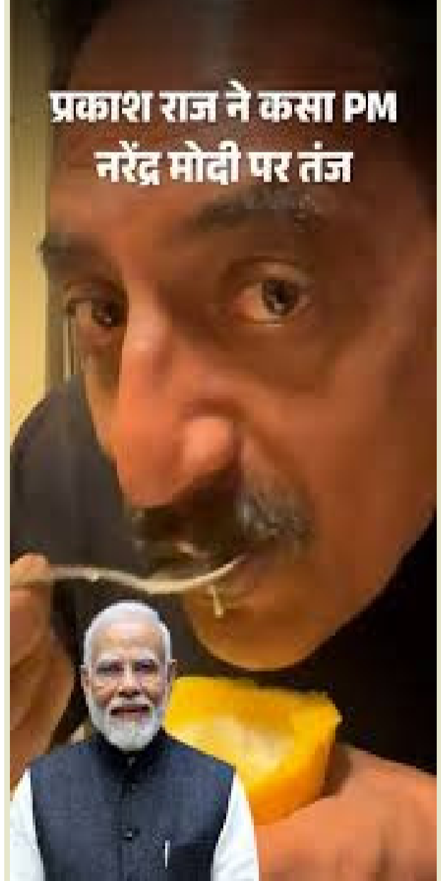
प्रकाश राज ने कसा PM नरेंद्र मोदी पर तंज

पसंद हैं। वे बहुत अच्छा काम कर रही हैं लेकिन अगर मुझे पर किसी का जादू है तो वे काजोल और करिश्मा हैं। मैं आज भी सोचती हूँ कि वो इतना अच्छा काम कैसे कर लेती थीं। आपके आने वाले प्रोजेक्ट कौन-से हैं? कुर्बान के बाद आमिर के साथ 3 इंडियट्स आ रही है। उसके बाद करण जोहर की एक फिल्म है, जिसमें काजोल मेरे साथ काम कर रही हैं। इसके साथ ही सैफअली खान की होम प्रोडक्शन फिल्म एजेंट विनोद कर रही हैं।