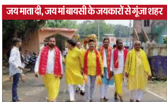
जय माता दी, जय मां बायसी के जयकारों से गुंजा शहर

साहिबगंज। शहर के मां बायसी मंदिर प्रांगण में सोमवार को सात दिवसीय नौ कुण्डीय शतचंडी महायज्ञ सह श्रीमद भागवत कथा को लेकर भव्य कलश यात्रा निकाली गई। 2100 कलश के साथ महिलाएं कलश यात्रा में शामिल हुईं। ढोल नगाड़ा गाजे बाजे घोड़ा रथ के साथ भव्य कलश यात्रा मां बायसी मंदिर प्रांगण से निकलकर बड़तल्ला, कृष्ण नगर, कॉलेज रोड, पूर्वी फाटक, एसडीओ कोठी होते हुए ओझा टोली गंगा घाट पहुंचकर गंगा तट में वैदिक मंत्रोच्चारण के साथ विधिवत रूप से कलश चालभरी किया और कलश पूजन किया। वही श्रीधाम वृंदावन की कथा