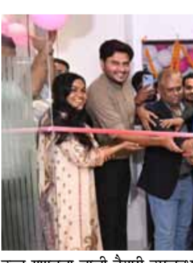
उच्च गुणवत्ता वाली तैयारी उपलब्ध कराना है

उच्च गुणवत्ता वाली तैयारी उपलब्ध कराना है, ताकि उन्हें दिल्ली या अन्य बड़े शहरों की ओर रुख न करना पड़े। पटना के विस्तारित सेंटर में आधुनिक क्लासरूम, लाइब्रेरी, मेटरशिप स्पेस और छात्र सहायता सेवाओं की सुविधा उपलब्ध कराई गई है। इसे बिहार के विभिन्न जिलों से आने वाले अभ्यर्थियों की जरूरतों को ध्यान में रखकर विकसित किया गया है। संस्थान ने मार्च 2025 में पटना में अपना पहला केंद्र शुरू किया था। वर्तमान में यहां करीब 600 छात्र नामांकित हैं। संस्थान का लक्ष्य अगले एक वर्ष में 1,000 से अधिक नए अभ्यर्थियों को जोड़ने का है। StudyIQ ने पटना केंद्र में अपना S-M-A-R-T लर्निंग मॉडल लागू किया है, जिसमें क्लासरूम शिक्षण