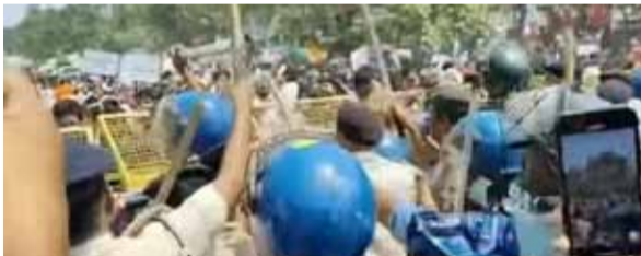
» दर्जन भर से ज्यादा छात्र घायल, कई के सर फूटे,पुलिस ने महिला अभ्यर्थियों को भी दौड़ा-दौड़ा कर पीटा

पटना। टीआरई-4 शिक्षक भर्ती का नोटिफिकेशन जारी करने और BPSC नियमों में बदलाव का विरोध प्रदर्शन कर रहे शिक्षक अभ्यर्थियों पर आज पटना में पुलिस ने जमकर लाठीचार्ज किया। इस लाठी चार्ज में दर्जन भर से ज्यादा छात्र घायल हुए हैं। कई छात्रों के सर फट गया है। पुलिस ने महिला अभ्यर्थियों को भी दौड़ा-दौड़ा कर पीटा। इस दरमियान महिला पुलिसकर्मियों का इशारा अला पता नहीं था। प्रदर्शनकारी शिक्षक अभ्यर्थियों का विशाल प्रदर्शन पटना कॉलेज से शुरू हुआ।बड़ी संख्या में छात्र टीआरई-4 का नोटिफिकेशन जारी करने की मांग को लेकर पटना कॉलेज से बेली रोड स्थित बीपीएससी कार्यालय जा रहे थे। गौर तलब है कि बेली रोड प्रतिबंधित क्षेत्र है और उसमें धरना जुलूस प्रदर्शन या किसी प्रकार के आंदोलन की सख्त मनाही है। प्रदर्शनकारी अभ्यर्थी गांधी