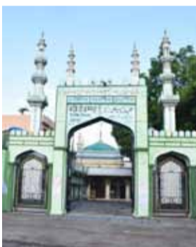
नई सोच एक्सप्रेस