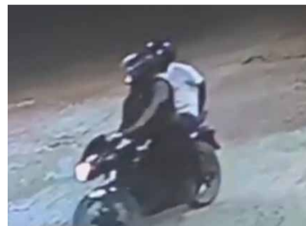
नई सोच एक्सप्रेस