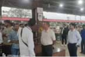
नई सोच एक्सप्रेस