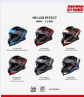
नई सोच एक्सप्रेस

पटना।वैश्विक स्तर पर दोपहिया वाहनों के लिए हेलमेट बनाने वाली मशहूर कंपनियों में से एक, स्टड्स एक्सप्रेसरिज लिमिटेड ने अपने प्रमुख फुल-फेस (पूरे चेहरे को ढंकरने वाले) हेलमेट के ताजाजीन संस्करण, हेलियोस इफेक्ट के लॉन्च की घोषणा की। हेलियोस इफेक्ट ऐसे मॉडल को रंग-रूप से लिहाज से नई विशुद्ध पहचान प्रदान करता है, जिसने अलग-अलग जगहों पर खुद को प्रमाणित किया है। यह अपेक्षाकृत अधिक उल्लेखनीय ग्राफिक कैरेक्टर पेश करता है, साथ ही उन सुरक्षा और आराम की विशेषताओं को भी बनाए रखता है जिन्होंने वजह से यह भारत और अन्य बाजारों में शानदार ब्रांड के रूप में लोकप्रिय हुआ है। हेलियोस इफेक्ट एक्सप्रेसरिज लिमिटेड के