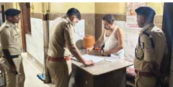
नई सोच एक्सप्रेस

जहानाबाद (हसनैन दीवाना)। पुलिस अधीक्षक के निर्देशन में मध्य रात्रि जिले के सभी थाना क्षेत्रों में एक साथ विशेष रैंडम होटल चेकिंग अभियान चलाया गया। आम नागरिकों की सुरक्षा सुनिश्चित करने और असामाजिक व सन्देहास्पद तत्वों पर नकेल कसने के उद्देश्य से खुद पुलिस अधीक्षक, अपर पुलिस अधीक्षक एवं अनुमंडल पुलिस पदाधिकारी घोसी ने इस पूरे सच ऑपरेशन का नेतृत्व किया। विभिन्न होटलों के कमरों, एंटी रजिस्ट्रारों और वहां ठहरे मुसाफिरों के पहचान पत्रों की बारीकी से जांच की गई। होटल और ढाबा संचालकों को सख्त हिदायत दी गई कि किसी भी संदेहास्पद व्यक्ति या