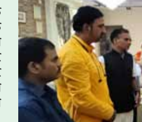
नई सोच एक्सप्रेस