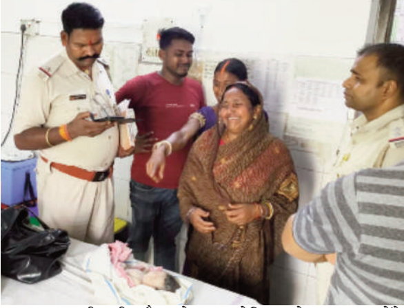
नवजात बच्ची की मौत हो गई। बच्चे की मौत की खबर मिलते ही परिजन और ग्रामीण आक्रोशित हो गए। उन्होंने अस्पताल प्रबंधन पर इलाज में चोर लापरवाही बरतने का आरोप