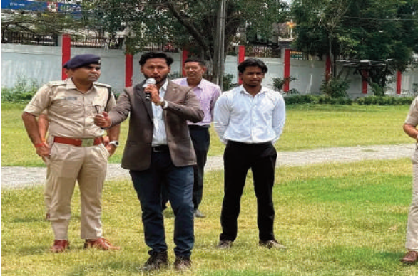
अपने कार्यों को बेहतर बना रही है, जिसका सकारात्मक अंतर अपराध के आंकड़ों में कमी के रूप में देखने को मिला है। एसएसपी ने आगे बताया कि जिले के सभी थानों को दोपहिया और चारपहिया वाहन उपलब्ध कराए गए हैं, साथ ही नए कंप्यूटर सिस्टम भी लगाए गए हैं, जिससे पुलिसिंग को डिजिटल और तेज बनाया जा सके। उन्होंने ड्रोन तकनीक के महत्व पर जोर देते हुए कहा कि वीडियो फुटेज के दौरान निगरानी में ड्रोन बेहद उपयोगी साबित होता है। इसके अलावा ऊंची इमारतों, भीड़भाड़ वाले