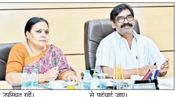
मुख्यमंत्री ने पंचायत भवनों में ठेस अपरिग्रह प्रबंधन की कार्ययोजना तैयार करने तथा सूखे एवं गीले कचरे के पृथक्करण के लिए लोगों को जागरूक करने पर जोर दिया। उन्होंने प्लास्टिक कचरे के पृथक्करण और उसके उचित निस्तारण पर भी विशेष बल दिया।

संवाददाता रांची । झारखंड के मुख्यमंत्री हेमन्त सोरेन ने बुधवार को पंचायती राज विभाग की उच्च स्तरीय समीक्षा बैठक की। बैठक में पंचायती राज विभाग एवं ग्रामीण कार्य विभाग के तहत संचालित विकास योजनाओं की प्रगति की विस्तृत समीक्षा की गई। मुख्यमंत्री ने ग्रामीण क्षेत्रों की आधारभूत संरचना, सड़क संयक, पंचायत स्तरीय सेवाओं और विकास योजनाओं के प्रभावी क्रियान्वयन पर विशेष जोर दिया। उन्होंने कहा कि ग्रामीण विकास के लिए बेहतर कार्ययोजना बनाकर योजनाओं का लाभ अंतिम व्यक्ति तक पहुंचाना सुनिश्चित किया जाए। बैठक में पंचायती राज एवं ग्रामीण कार्य विभाग की मंत्री दीपिका पांडेय सिंह भी उपस्थित रही। समीक्षा के दौरान मुख्यमंत्री ने पंचायत स्तर पर पारदर्शिता बढ़ाने के निर्देश दिए। उन्होंने अधिकारियों से कहा कि पंचायतों के माध्यम से बाल विवाह और महिला हिंसा की रोकथाम के लिए जागरूकता अभियान चलाया जाए तथा हेल्पलाइन नंबरों की जानकारी आमजन तक प्रभावी रूप से पहुंचाई जाए। मुख्यमंत्री ने पंचायत भवनों में ठेस अपरिग्रह प्रबंधन की कार्ययोजना तैयार करने तथा सूखे एवं गीले कचरे के पृथक्करण के लिए लोगों को जागरूक करने पर जोर दिया। उन्होंने प्लास्टिक कचरे के पृथक्करण और उसके उचित निस्तारण पर भी विशेष बल दिया।