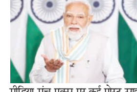
प्रधानमंत्री ने बुधवार को सोशल मीडिया मंच एक्स पर कई पोस्ट साझा करते हुए कहा कि अत्यधिक गर्मी सभी के लिए चुनौतीपूर्ण है। उन्होंने लोगों को हीट एजेंसी के लक्षणों जैसे चक्कर आना, मलती और अत्यधिक थकान को नजरअंदाज नहीं करने की सलाह दी। उन्होंने कहा कि यदि किसी व्यक्ति को कमजोरी, सिरदर्द या अस्वस्थता महसूस हो तो उसे तुरंत ठंडी और छायादार जगह पर ले जाकर पानी और ओआरएस उपलब्ध कराना चाहिए। प्रधानमंत्री ने कहा कि बच्चे, बुजुर्ग और बाहर काम करने वाले लोग अत्यधिक गर्मी में सबसे ज्यादा प्रभावित होंगे। उन्होंने चेतावनी दी कि लक्षणों की अनदेखी करने पर स्थिति गंभीर होकर हीटस्ट्रोक का रूप ले सकती है।

मीडिया मंच एक्स पर कई पोस्ट साझा करते हुए कहा कि अत्यधिक गर्मी सभी के लिए चुनौतीपूर्ण है। उन्होंने लोगों को हीट एजेंसी के लक्षणों जैसे चक्कर आना, मलती और अत्यधिक थकान को नजरअंदाज नहीं करने की सलाह दी। उन्होंने कहा कि यदि किसी व्यक्ति को कमजोरी, सिरदर्द या अस्वस्थता महसूस हो तो उसे तुरंत ठंडी और छायादार जगह पर ले जाकर पानी और ओआरएस उपलब्ध कराना चाहिए। प्रधानमंत्री ने कहा कि बच्चे, बुजुर्ग और बाहर काम करने वाले लोग अत्यधिक गर्मी में सबसे ज्यादा प्रभावित होंगे। उन्होंने चेतावनी दी कि लक्षणों की अनदेखी करने पर स्थिति गंभीर होकर हीटस्ट्रोक का रूप ले सकती है।