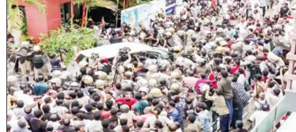
वर्तमान नेता प्रतिपक्ष पिनारै विजयन के आवास पर कई घंटों तक चली तलाशी के बाद जब ईडी अधिकारियों की टीम परिसर से बाहर निकली, तब वहां मौजूद सीपीआई-एम कार्यकर्ताओं की भीड़ उग्र हो गई और अधिकारियों के काफिले पर हमला कर दिया। केरल पुलिस ने लगभग 100 पार्टी कार्यकर्ताओं के खिलाफ मामला दर्ज किया है।

एजेंसी तिरुवनंतपुरम । कोचीन मिन्सल्स एंड रूटाइल लिमिटेड (सीएमआरएल)-एक्सलॉरिजिक वित्तीय लेनदेन और धनशोधन मामले में प्रवर्तन निदेशालय (ईडी) की कार्रवाई के बाद बुधवार को केरल की राजधानी तिरुवनंतपुरम में जबर्दस्त राजनीतिक तनाव और हिंसक प्रदर्शन देखने को मिला। पूर्व मुख्यमंत्री और