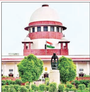
कोर्ट ने यह भी माना कि चुनाव आयोग द्वारा मांगे गए दस्तावेज मनमाने नहीं हैं। पीठ ने कहा, 11

एजेंसी नई दिल्ली । सुप्रीम कोर्ट ने बिहार में मतदाता सूचियों के लिए शुरू की गई विशेष गहन पुनरीक्षण (एसआईआर) प्रक्रिया को वैध और संवैधानिक करार देते हुए चुनाव आयोग को बड़े रहत दी है। अदालत ने स्पष्ट कहा कि केवल इसलिए इस प्रक्रिया को अवैध नहीं ठहराया जा सकता कि यह मतदाता सूची संशोधन की सामान्य प्रक्रिया से अलग है। मुख्य न्यायाधीश सर्वकांत की अध्यक्षता वाली पीठ ने कहा कि चुनाव आयोग को मतदाता सूचियों की शुद्धता सुनिश्चित करने का अधिकार प्राप्त है और एसआईआर उसी अधिकार के दायरे में की जा रही प्रक्रिया है। अदालत ने अपने फैसले में कहा कि एसआईआर प्रक्रिया पूरी तरह कानून के अनुरूप है।