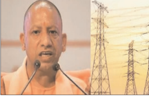
वीआईपी क्लव्हर खत्म, सभी के लिए एक नियम

लखनऊ। उत्तर प्रदेश में रिकॉर्ड तोड़ गर्मी और आसमान से बरसती आग के बीच बिजली संकट को लेकर हाहाकार मचा हुआ है। राज्य में गहराते इस संकट को देखते हुए मुख्यमंत्री योगी आदित्यनाथ ने बेहद सख्त रुख अख्तियार कर लिया है। मुख्यमंत्री ने आज (24 मई 2026) राजधानी लखनऊ में बिजली विभाग के आला अधिकारियों, मंत्रियों और उत्तर प्रदेश पावर कॉर्पोरेशन लिमिटेड के शीर्ष प्रबंधन के साथ एक आपातकालीन समीक्षा बैठक बुलाई। इस उच्च स्तरीय बैठक में सीएम योगी का कड़ा रुख देखने को मिला। उन्होंने स्पष्ट शब्दों में चेतावनी दी कि जनता को परेशानी में डालने वाली बिजली कटौती किसी भी कीमत पर बर्दाश्त नहीं की जाएगी। लापरवाही बरतने वाले अधिकारियों के खिलाफ तुरंत कार्रवाई करने के निर्देश के बाद विभाग में हड़कंप मच गया है। लापरवाही पर तुरंत एक्शन: 2 अधिशासी अभियंता सस्पेंड बैठक शुरू होते ही मुख्यमंत्री ने जिलों से आ रही बिजली कटौती और फॉल्ट की शिकायतों की रिपोर्ट तलब की। जनता की समस्याओं को नजरअंदाज करने और ड्यूटी में