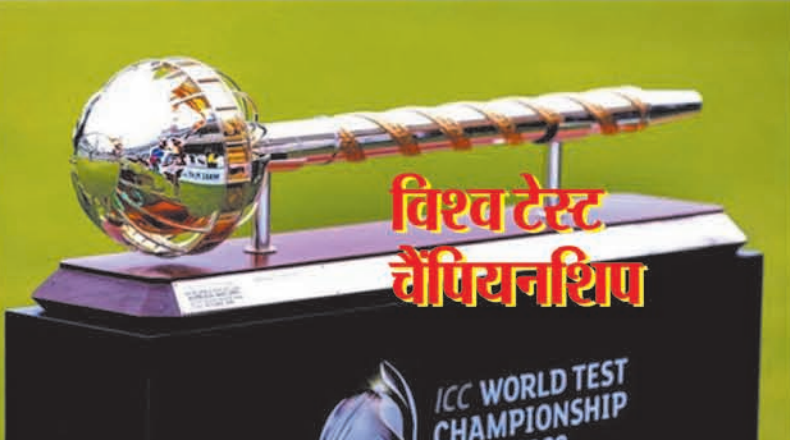
विश्व टेस्ट चैंपियनशिप

सिलहट (एजेंसी)। बांग्लादेश ने पाकिस्तान को टेस्ट सीरीज में 2-0 से हराकर इतिहास रच दिया। सिलहट टेस्ट में 78 रन की जीत के साथ बांग्लादेश ने पाकिस्तान का सूपड़ा साफ किया। हालांकि इस नतीजे का असर भारत पर पड़ा, जो विश्व टेस्ट