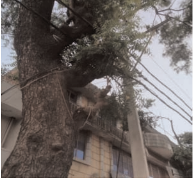
बैठक लेते हुए फौरी राहत के निर्देश दिए हैं। इन सबके बावजूद वन विभाग के स्थानीय अफसर में शासन प्रशासन के दिशा निर्देश को ठेग पर रखा।

हाईवोल्टेज बिजली के तार पर अटका नीम का पेड़, जनता कर रही शिकायत, विभाग बना काट का उल्लू प्रयागराज - लखनऊ राजमार्ग स्थित नवाबगंज चौराहे पर बैंक ऑफ बड़ौदा के ठीक सामने नीम का भारी भरकम पेड़ टूट कर हाई वोल्टेज बिजली के करंट प्रवाहित तार पर अटका हुआ है। पिछले एक सप्ताह से लगातार वन विभाग के इस पेड़ को हटाने की मांग की जा रही है लेकिन विभागीय स्थानीय अधिकारी इस गंभीर समस्या की तरफ से मुंह मोड़कर बैठे हैं। भीड़भाड़ वाली इस जगह पर बैंक ऑफ बड़ौदा, खरीददारों की भीड़ हमेशा बनी रहती है आशंका इस बात की की जा रही है कि कभी भी बिजली करंट प्रवाहित तार पर अटका या पेड़ गंभीर हादसे को अंजाम दे सकता है। इस समस्या से परेशान स्थानीय लोगों ने जिला प्रशासन से प्रभावी जांच और देखियों को दंडित करने की मांग की है।