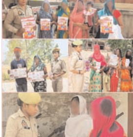
महिलाओं/बालिकाओं को उनके अधिकारों एवं सरकार द्वारा चलायी

सबसे तेज प्रयागराज प्रयागराज। पुलिस आयुक्त व अपर पुलिस आयुक्त के निर्देशन में व पुलिस उपायुक्त गंगानगर व अपर पुलिस उपायुक्त गंगानगर के कुशल पर्वविक्षेप में गुरुवार को गंगानगर जोन के समस्त थानों की महिला पुलिसकर्मियों/मिशन शक्ति टीमों ने अपने-अपने थाना क्षेत्रों के प्रमुख बाजारों, स्कूलों, शिक्षण संस्थानों, धार्मिक स्थलों एवं अन्य भीड़-भाड़ वाले सार्वजनिक स्थलों पर जाकर