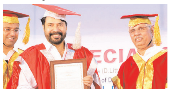
के लिए सम्मानित किया है। ममूटी ने अपने करियर में 400 से अधिक फिल्मों में अभिनय किया है। आज वह भी फिल्म उद्योग के सबसे मशहूर सितारों में से एक बने हुए हैं।

मलयालम सिनेमा के दिग्गज अभिनेता ममूटी एक बार फिर चर्चा में हैं। उन्हें केरल के महात्मा गांधी विश्वविद्यालय की तरफ से मानद डॉक्टरेट से सम्मानित किया गया है। अभिनेता को भारतीय सिनेमा में पांच दशकों से ज्यादा समय तक दिए गए उनके योगदान के लिए 'डॉक्टर ऑफ लेटर्स' ममूटी को मिला सम्मान केरल के राज्यपाल राजेंद्र आलेंकर ने विश्वविद्यालय के दीक्षांत समारोह के दौरान अभिनेता को यह सम्मान दिया। यह ममूटी के लिए तीसरा मानद डॉक्टरेट है। विश्वविद्यालय ने ममूटी को मलयालम, तमिल, तेलुगु, कन्नड़, हिंदी और अंग्रेजी सहित कई भाषाओं के भारतीय सिनेमा में उनके असीम योगदान