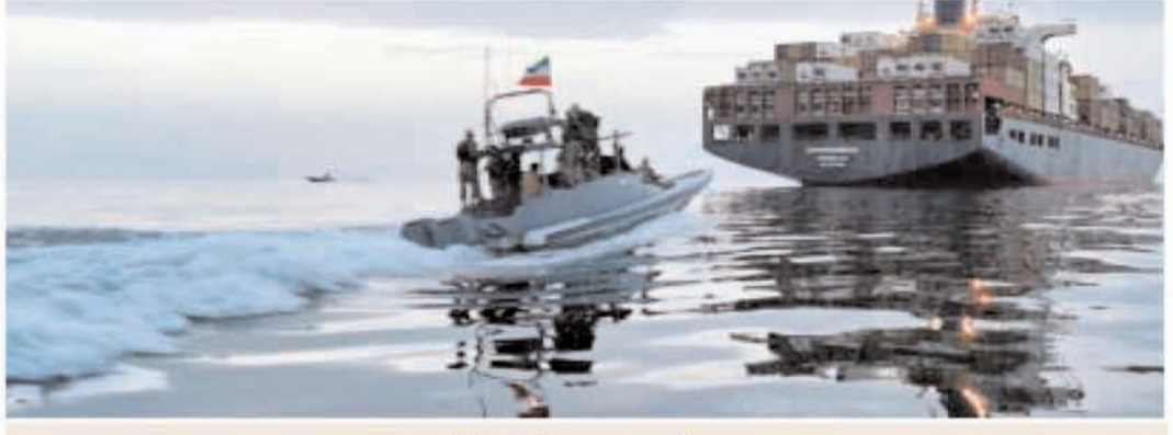
अमेरिकी सेना का स्पष्टीकरण

तेहरान, एजेंसी। ईरान और अमेरिका के बीच चल रही शांति वार्ता के बीच हालात फिर से बहुत ज्यादा विस्फोटक और तनावपूर्ण हो गए हैं। अमेरिका ने होर्मुज और बंदरअब्बास इलाके में ईरानी नौसेना की नावों और मिसाइल टिकाओं को अपना सीधा निशाना बनाया है। अमेरिकी हमले के बाद ईरान के सुप्रीम लीडर मोजतबा खामेनेई ने बेहद आक्रामक बयान देते हुए अपनी गंभीर चेतावनी दी है। उन्होंने स्पष्ट रूप से कहा है कि इस नए हमले के बाद इजरायल का दुनिया के नवशे से मिटना अब पूरी तरह से तय है। ईरान की इस खतरनाक धमकी को चेस्ट पेशिया में संभावित बड़े सैन्य टकराव की एक बहुत ही गंभीर चेतावनी माना जा रहा है। अमेरिका के राष्ट्रपति डोनाल्ड ट्रंप ने इस भयंकर हमले के कुछ घंटे पहले ही ईरान के साथ शांति की उम्मीद जताई थी। लेकिन अचानक हुए इस बड़े हमले ने पूरी दुनिया को एक नए और भयानक महायुद्ध की गहरी चिंता में डाल दिया है। ईरान ने दावा किया है कि उसने अमेरिका को करारा जवाब देकर उसका खतरनाक मकसद पूरी तरह से नाकाम कर दिया है।