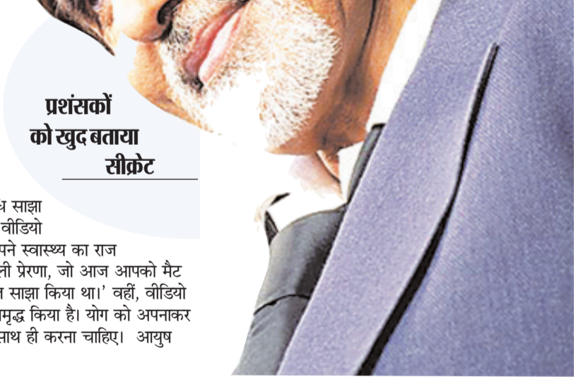
प्रशंसकों को खुद बताया सीक्रेट

विश्व योग दिवस के करीब आने के साथ ही भारत सरकार का आयुष मंत्रालय योग को जन-जन तक पहुंचाने के लिए लगातार नए प्रयास कर रहा है। मंत्रालय नए योगासनों की विस्तृत जानकारी, उनके फायदे और सही करने की विधि साझा कर आम लोगों को योग के प्रति लगातार प्रेरित कर रहा है। इसी क्रम में मंत्रालय ने अभिनेता अमिताभ बच्चन का एक वीडियो अपने ऑफिशियल इंस्टाग्राम अकाउंट पर पोस्ट किया है। पोस्ट किए पुराने वीडियो में अमिताभ बच्चन आमजन को अपने स्वास्थ्य का राज बताते हुए रोजाना योग करने की सलाह दे रहे हैं। मंत्रालय ने वीडियो के साथ कैप्शन लिखा, 'अमिताभ बच्चन से मिली प्रेरणा, जो आज आपको मेट पर ले आएगी यानी आप योगासन के प्रति उत्सुक होंगे। जब इस दिग्गज हस्ती ने खुद एक समृद्ध जीवन का अपना राज साझा किया था।' वहीं, वीडियो में अमिताभ बच्चन स्पष्ट शब्दों में कहते नजर आते हैं, 'मैं हर रोज योग करता हूँ। इसने मेरे जीवन को संवारा और समृद्ध किया है। योग को अपनाकर जीवन को उसकी पूरी क्षमता के साथ जिया जा सकता है। ध्यान रखें कि योग हमेशा उचित मार्गदर्शन और परामर्श के साथ ही करना चाहिए। आयुष मंत्रालय का यह कदम विश्व योग दिवस (21 जून) की तैयारियों को और मजबूत बनाता है।