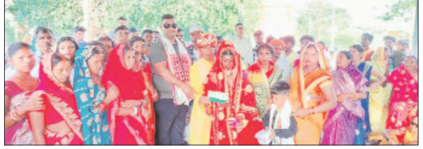
इस दौरान बड़ी संख्या में स्थानीय लोग भी उनसे मिलने पहुंचे। दौरे के क्रम में सत्यानंद भोक्ता लोगों की समस्याओं से भी रूबरू हो रहे हैं। ग्रामीणों ने सड़क, बिजली, पानी, राशन और स्वास्थ्य जैसी समस्याओं को उनके सामने रखा। कई स्थानों पर लोगों ने भोजन व विकास कार्यों की गति बढ़ाने की मांग भी की। पूर्व मंत्री ने लोगों को भरोसा दिलाया कि उनकी समस्याओं को संबंधित विभागों तक पहुंचाकर समाधान करने का प्रयास किया जाएगा। ग्रामीणों का कहना है कि पूर्व मंत्री सुधाकर गांवों में पहुंचकर लोगों के सुख-दुख में शामिल हो रहे हैं, जिससे आम लोगों के बीच उनका जुड़ाव मजबूत बना हुआ है। वहीं राजनीतिक जानकार इसे आगामी चुनावी तैयारियों और जनसंपर्क अभियान से भी जोड़कर देख रहे हैं। लगातार क्षेत्र भ्रमण के कारण पूर्व मंत्री की सक्रियता एक बार फिर चर्चा में है। गांवों में उनके पहुंचने से कार्यकर्ताओं में भी उत्साह देखा जा रहा है।