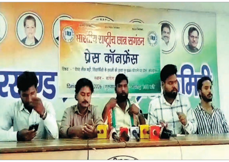
स्तर की परीक्षा में गड़बड़ी होना बेहद चिंताजनक है। उन्होंने कहा कि देश भर के

रांची। देश भर में नीट परीक्षा पेपर लीक मामले को लेकर बढ़ते विरोध के बीच राष्ट्रीय छात्र संगठन (एनएसयूआई) ने देश की शिक्षा व्यवस्था पर गंभीर सवाल खड़े किया है। गुरुवार को प्रदेश कांग्रेस कार्यालय में आयोजित प्रेस वार्ता में एनएसयूआई के नेताओं ने कहा कि परीक्षा में हुई अनियमितताओं ने लाखों छात्रों और उनके परिवारों के भविष्य को संकट में डाल दिया है।