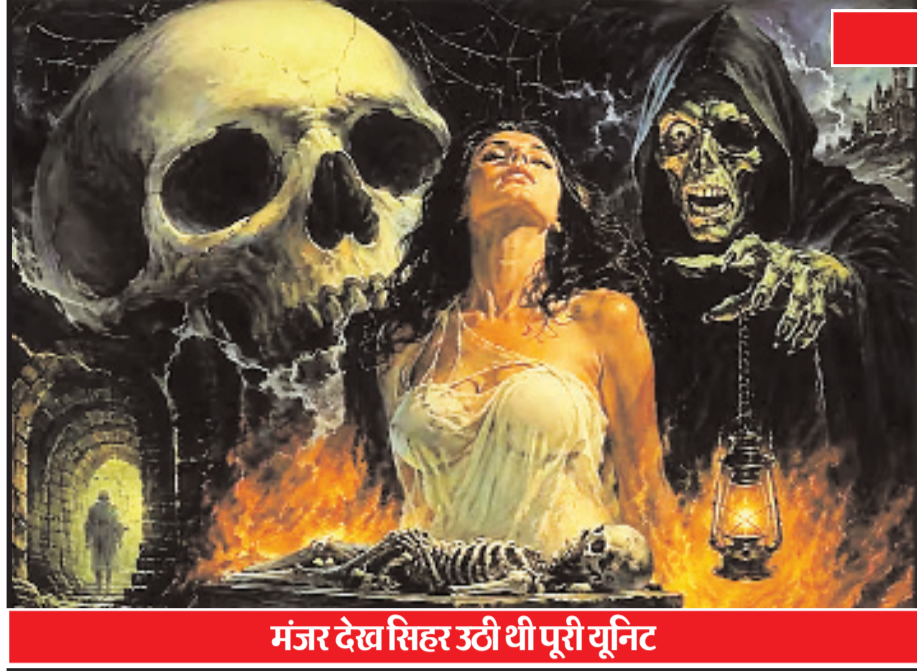
मंजर देव सिहर उठी थी पूरी यूनिट