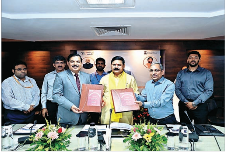
विभिन्न परिचालन क्षेत्रों में किए गए कार्यों को चालू वित्त वर्ष 2026-27 के लक्ष्यों के साथ प्रस्तुत किया गया। इस अवसर पर मंत्री ने भारत में क्रिटिकल मिनरल्स की खोज के

रांची। सीएमपीडीआई और एमईसीएल के बीच कोयला और अन्य खनिजों के संवर्धन के लिए एमओयू पर हस्ताक्षर किया गया। इससे दोनों प्रमुख गवेषण एजेंसियों के बीच सहभागिता आगे और बढ़ेगी। ऊर्जा एवं गैर-ऊर्जा संबंधी खनिजों की खोज में सुगमता आएगी। कोयला एवं खान राज्यमंत्री सतीश चंद्र दुबे की उपस्थिति में एमओयू हुआ। समीक्षा बैठक के दौरान सीएमपीडीआई द्वारा वर्ष 2025-26 के दौरान गवेषण, रिपोर्ट की तैयारी, पूंजीगत व्यय, अनुसंधान एवं विकास परियोजनाएं, सीएसआर फंड और सौर परियोजनाएं जैसे