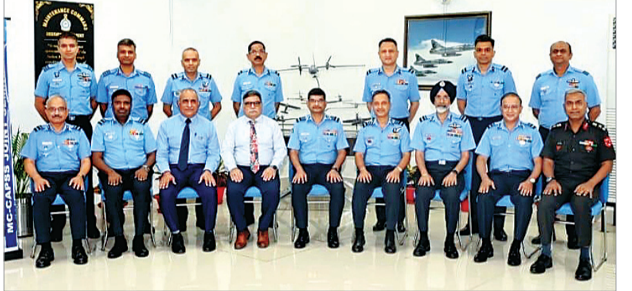
नागपुर में एयरोस्पेस पावर सेमिनार आयोजित