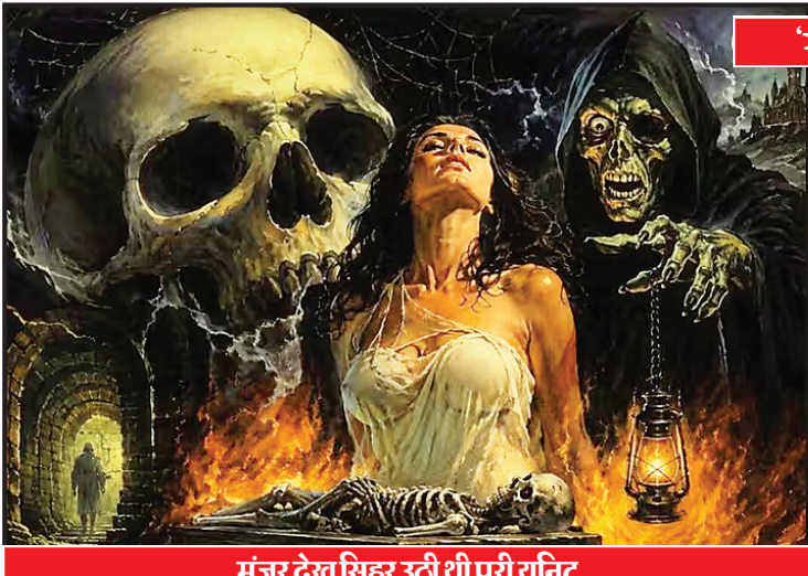
मंजर देख सिहर उठी थी पूरी यूनिट