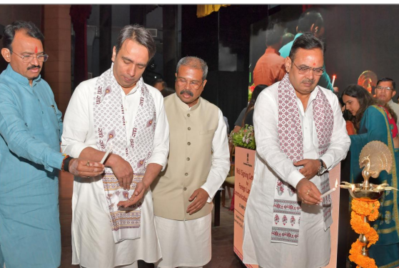
नीति 2020 के तहत शिक्षा को बहुभाषी और अंतरराष्ट्रीय स्वरूप देने पर विशेष बल दिया गया है, जिससे युवाओं के लिए वैश्विक अवसरों के द्वार खुलेंगे।

कार्यक्रम को संबोधित करते हुए केंद्रीय शिक्षा मंत्री धर्मप्र प्रधान ने कहा कि भाषा केवल संवाद का माध्यम नहीं बल्कि समाज को जोड़ने का सशक्त माध्यम है। उन्होंने कहा कि राष्ट्रीय शिक्षा