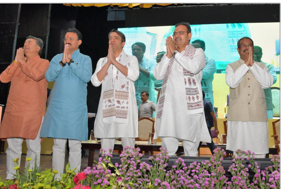
निर्माण कराया गया है। साथ ही युवाओं को सवा लाख से अधिक सरकारी नौकरियों दी गई हैं और 1 लाख 33 हजार पदों पर भर्ती प्रक्रिया जारी है। निजी क्षेत्र में भी लगभग 3 लाख रोजगार उपलब्ध कराए गए हैं।

उन्होंने कहा कि राज्य सरकार शिक्षा को रोजगार से जोड़ने के लिए निरंतर कार्य कर रही है। प्रदेश में 71 नए राजकीय महाविद्यालय खोले गए हैं तथा 185 महाविद्यालय भवनों का