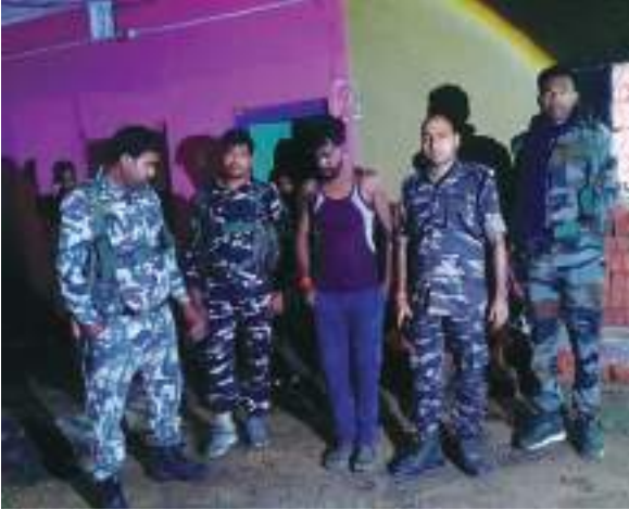
टीमों ने विभिन्न थाना क्षेत्रों में कुल 100 ठिकानों पर एक साथ छापेमारी की।

झारखंड दर्शन संवाददाता हजारीबाग। पुलिस अधीक्षक के निर्देश पर जिलेभर में अवैध मादक पदार्थ के कारोबार और सेवन के खिलाफ मंगलवार देर रात विशेष अभियान चलाया गया। जिले के सभी पुलिस उपाधीक्षक और पुलिस निरीक्षकों के नेतृत्व में चलाए गए इस अभियान में पिछले पांच वर्षों में मादक पदार्थ के मामलों में शामिल आरोपियों तथा नशे के कारोबार और सेवन से जुड़े लोगों को निशाने पर लिया गया। अभियान के तहत जिलेभर में 43 टीमों का गठन किया गया था, जिसमें 118 पुलिस पदाधिकारी और जवान शामिल थे। गठित