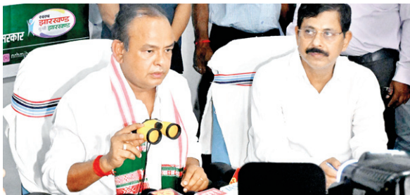
स्वास्थ्य मंत्री ने कहा-तकनीकी प्रक्रियाओं को घोटाला बताकर जनता को भ्रमित कर रहा विपक्ष

रांची। स्वास्थ्य विभाग में कथित अनियमितताओं को लेकर नेता प्रतिपक्ष बाबूलाल मरांडी द्वारा लगाए गए आरोपों पर स्वास्थ्य मंत्री डॉ इरफान अंसारी ने बुधवार को प्रेस वार्ता में तथ्यात्मक जवाब दिया। उन्होंने विपक्ष पर बिना तथ्यों के जनता को गुमराह करने और राज्य सरकार की छवि धूमिल करने का आरोप लगाया। डॉ इरफान अंसारी ने कहा कि नेता प्रतिपक्ष जैसे जिम्मेदार पद पर बैठे व्यक्ति को राजनीतिक लाभ के अंतर यह साबित करें कि जिन 251 एंबुलेंसों की बात कर रहे हैं, वे आखिर कहाँ पड़ी हैं। यदि वे अपने आरोपों का प्रमाण नहीं दे पाए, तो मैं उन्हें खिलाफ एफआईआर दर्ज कराऊंगा। उन्होंने कहा कि बाबूलाल मरांडी को निम्न स्तर की राजनीति से