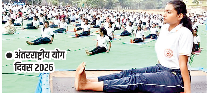
अंतरराष्ट्रीय योग दिवस 2026