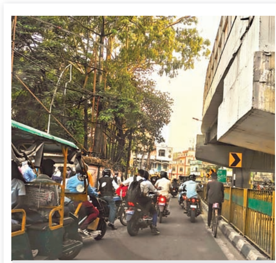
कचहरी के पास वैडर मार्केट के आगे कुछ दिनों पहले काम हटाया गया था वहां फिर से दुकानों सज गई हैं, आज एक ऑटो के धक्के से वाइक सवार गिर गया और चोट लगी।