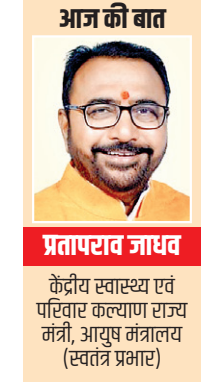
आज की बात प्रतापराज्य जाधव केंद्रीय स्वास्थ्य एवं परिवार कल्याण राज्य मंत्री, आयुष मंत्रालय (स्वतंत्र प्रभार)