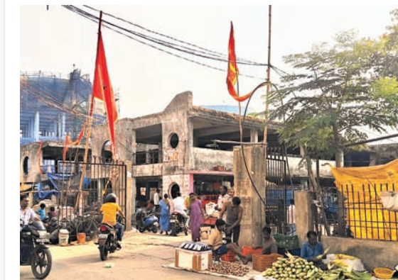
रातू रोड खादगढ़ा सक्की मार्केट के बाहर से कुछ दिनों पहले अतिक्रमण हटाया गया था। धीरे-धीरे सड़क किनारे फिर से दुकानें सज गई हैं। बीच में लाल घेरे में पुलिस का सिपाही खड़ा है उसकी कोई प्रतिक्रिया नहीं है।