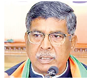
बेगूसरान वादिका और इसके साथ भारी ओला वृष्टि से किसानों को हुई है भारी क्षति