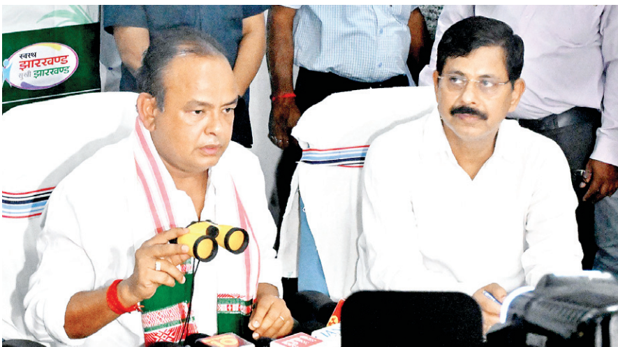
स्वास्थ्य मंत्री ने कहा-तकनीकी प्रक्रियाओं को घोटाला बताकर जनता को भ्रमित कर रहा विपक्ष

रांची। स्वास्थ्य विभाग में कथित अनियमितताओं को लेकर नेता प्रतिपक्ष बाबूलाल मरांडी द्वारा लगाए गए आरोपों पर स्वास्थ्य मंत्री डॉ इरफान अंसारी ने बुधवार को प्रेस वार्ता में तथ्यात्मक जवाब दिया। उन्होंने विपक्ष पर बिना तथ्यों के जनता को गुमराह करने और राज्य सरकार की छवि धूमिल करने का आरोप लगाया। डॉ इरफान अंसारी ने कहा कि नेता प्रतिपक्ष जैसे जिम्मेदार पद पर बैठे व्यक्ति को राजनीतिक लाभ के लिए स्वास्थ्य जैसे संवेदनशील विभाग पर निराधार आरोप लगाने से बचना चाहिए। उन्होंने स्पष्ट कहा कि स्वास्थ्य विभाग जनता की जिंदगी से जुड़ा विभाग है, जहां परिस्थितियों के अनुसार त्वरित निर्णय लेने पड़ते हैं। मंत्री डॉ इरफान अंसारी ने कहा कि "फर्जीवाड़ा का हेड मास्टर बाबूलाल मरांडी हैं। वे एक सप्ताह के अंदर यह साबित करें कि जिन 251 एंबुलेंसों की बात कर रहे हैं, वे आखिर कहाँ पड़ी हैं। यदि वे अपने आरोपों का प्रमाण नहीं दे पाए, तो मैं उनके खिलाफ एफआईआर दर्ज कराऊंगा। उन्होंने कहा कि बाबूलाल मरांडी को निम्न स्तर की राजनीति से बचना चाहिए। मंत्री ने आगे कहा कि "बाबूलाल जी के कई काले कारनामों की जानकारी मेरे पास भी है, लेकिन मैं उनका सम्मान करता हूँ इसलिए व्यक्तिगत स्तर पर नहीं जाना। उन्होंने कहा कि दवाओं की खरीद के बाद उनकी गुणवत्ता की जांच अधिकृत लैब में कराई जाती है। जो दवाएं लैब टेस्ट में फेल हो