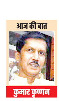
आज की बात कुमार कृष्णन