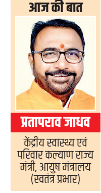
आज की बात प्रतापराज यादव केंद्रीय स्वास्थ्य एवं परिवार कल्याण राज्य मंत्री, आयुष मंत्रालय (स्वतंत्र प्रभार)