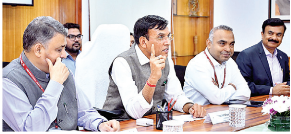
एजेंसी । नई दिल्ली

युवा मामले और खेल मंत्रालय ने भारत के एंटी-डोपिंग कानूनी ढांचे में प्रस्तावित संशोधनों को परामर्श के लिए सार्वजनिक डोमेन में रखा है। इसका उद्देश्य संगठित डोपिंग गतिविधियों के लिए आपराधिक दंड लागू करना है और एथलीटों को सामान्य एंटी-डोपिंग उल्लंघनों के लिए आपराधिक अभियोजन से बचना है। प्रस्तावित संशोधनों का उद्देश्य उस व्यापक इकोसिस्टम से निपटना है जो खेल में डोपिंग को संभव बनाता है। इसमें हार्मक, अवैध आपूर्तिकर्ता, संगठित सिंडिकेट और प्रतिबंधित पदार्थों तथा व्यावसायिक वितरण और प्रशासन में शामिल सहायक कर्मचारी शामिल हैं। मंत्रालय के अनुसार, प्रस्तावित ढांचा संगठित डोपिंग नेटवर्क से जुड़ी कई गतिविधियों को अपराध की श्रेणी में लाने का प्रयास करता है। इनमें प्रतिबंधित पदार्थों और तस्करी के तरीकों, अनाधिकृत बिक्री या वितरण, डोपिंग के उद्देश्य से एथलीटों को प्रतिबंधित पदार्थों का प्रशासन, नाबालिगों