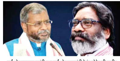
बाई और बाबूलाल मरांडी तथा बाई और मुख्यमंत्री हेमंत सोरेन की तस्वीरें

रांची। झारखंड की राजधानी रांची स्थित होटवार केंद्रीय कारा में न्यायिक हिरासत में बंद एक महिला कैदी के साथ कथित यौन शोषण का गंभीर मामला सामने आया है। जेल सुपरिंटेंडेंट पर महिला कैदी को बार-बार शोषित कर उसे गर्भवती बनाने का आरोप लगा है। भाजपा नेता एवं पूर्व मुख्यमंत्री बाबूलाल मरांडी ने इस प्रकरण को लेकर मुख्यमंत्री हेमंत सोरेन पर तीखा हमला बोला है। उन्होंने सोशल मीडिया पर मुख्यमंत्री को संबोधित करते हुए कहा कि न्यायिक अभिरक्षा में बंद महिला कैदी का शारीरिक शोषण जेल सुपरिंटेंडेंट द्वारा किया गया, जिससे वह गर्भवती हो गईं। मरांडी के मुख्य आरोप बाबूलाल मरांडी ने आरोप लगाया कि