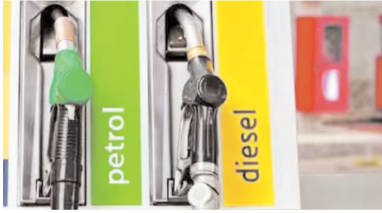
ऊर्जा का गंभीर संकट खड़ा हो गया है।

सरकार का मानना है कि इन सभी प्रयासों के परिणामस्वरूप भारत दुनिया भर में जारी ऊर्जा संकट का प्रभावी ढंग से सामना कर सकेगा। इससे विदेशी मुद्रा की बचत होगी, जिससे सरकारी कोष को मजबूत बनाए रखने में मदद मिलेगी। इसमें दोराय नहीं कि पिछले कुछ वर्षों में भारत सौर ऊर्जा के मामले में दुनिया के शीर्ष देशों तौर पर अभी भी जीवाश्म ईंधन से पूरी की जा रही है। ऐसे में जरूरी है कि मौजूदा संकट के दौरान आयातित ऊर्जा संसाधनों का उपयोग विवेकपूर्ण ढंग से और वास्तविक आवश्यकता के अनुसार ही किया जाए। गौरतलब है कि पश्चिम एशिया में संघर्ष के कारण होर्मुज जलमार्ग के बंद होने से तेल की आपूर्ति श्रृंखला बाधित हुई है, जिससे