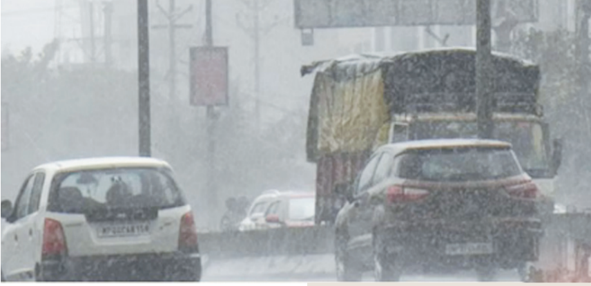
बस्ती, कुशीनगर, महाराजगंज, सिद्धार्थ नगर, गोंडा, बलरामपुर, श्रावस्ती, बहराइच व आस पास के क्षेत्र।