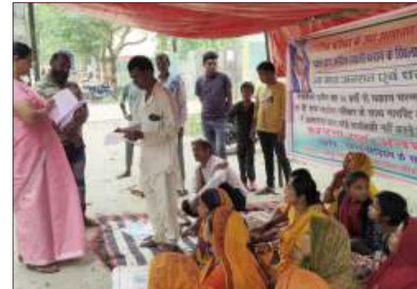
लोकतंत्र की आवाज