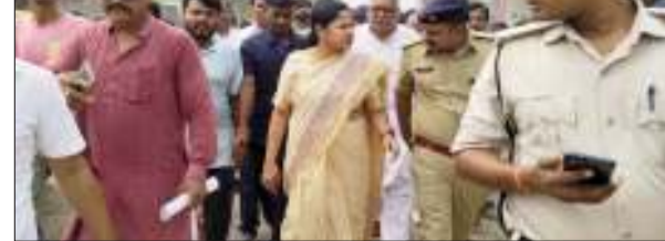
लोकतंत्र की आवाज

किसी भी अपराधी को बक्सा नहीं जाएगा। पुलिस अधीक्षक शुभांक मिश्रा ने मौके पर बताया कि पुलिस की कई टीमों गठित कर छात्रों की जा रही है। तकनीकी और मानवीय साक्ष्यों के आधार पर कार्रवाई चल रही है। एसपी ने दावा किया कि अपराधियों की गिरफ्तारी बहुत जल्द होगी। लोजपा (रा) के जिला