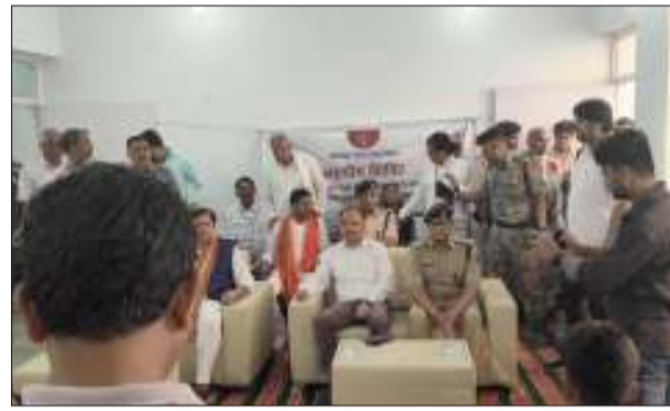
लोकतंत्र की आवाज