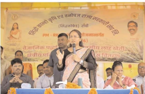
शिल्पी नेहा तिरकी ने किसानों को प्रेरित किया।

रांची (एजेंसी): रांची जिले के लापुंग प्रखंड स्थित स्टेडियम में सिद्धो कान्ठो फूडि एंव वनोपज राज्य सहकारी संघ लिमिटेड (सिद्धोकोड) द्वारा आयोजित वैज्ञानिक पद्धति आधारित एंव दिवसीय शैलीय लाह खेती प्रशिक्षण एवं टूरकिट वितरण कार्यक्रम में कृषि, पशुपालन एवं सहकारिता मंत्री शिल्पी नेहा तिरकी बतौर मुख्य अतिथि शामिल हुईं। कार्यक्रम के दौरान प्रखंड की मालगो, बाकोरोना एवं कच्छरीय पंचायतों से लाह खेती का प्रशिक्षण दिया गया तथा आवश्यक टूरकिट का वितरण किया गया। साथ ही आगामी जून-जुलाई माह में प्रत्येक किसान को ५-५ किलो की दर से कुसुमी एवं रंगीनी लाह बीज वन-प्रतिष्ठान अनुदान पर उपलब्ध कराया जाएगा।