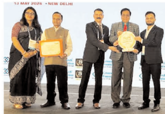
भय्य समारोह में बीसीसीएल सामाजिक क्षेत्र से जुड़े विशेषज्ञ सीएसआर टीम के सदस्यों ने भी उपस्थित रहे। बीसीसीएल

बीसीसीएल को यह सम्मान 'किंग डेवलपमेंट' तथा 'प्रमोशन ऑफ एजुकेशन' श्रेणियों में प्रदान किया गया। ये पुरस्कार कंपनी द्वारा समाज के विभिन्न वर्गों, विशेषकर युवाओं और वंचित समुदायों के सहायक बनने हेतु किए जा रहे हैं। पुरस्कार ग्रहण किया। इस अवसर पर विभिन्न उद्योगों के वरिष्ठ अधिकारी, नीतिनिर्माता तथा