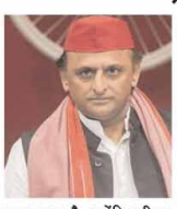
पसरा हुआ है, क्योंकि परिवार के अधिकार सत्य लखनऊ रखा हो पाया है। इटावा और सैफई क्षेत्र में भी इस दुःख घटना के बाद शोक का माहौल देखा जा रहा है। राज्य महिला आयोग