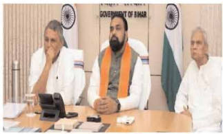
सैलरी मिलती है अब उसमें 20% रुपया इजाफा किया गया है। वहीं 2.24 लाख रुपये मूल वेतन पाने वाले अधिकारियों को अब हर महीने 48,000 रुपये बढ़ाकर दिए जाएंगे। पेशनर्स के

पटना (एजेंसी): बिहार के नए सीएम समाप्त चौधरी के निदेशों की बुधवार को बैठक हुई। बैठक में कुल 11 एजेंडों पर मुहर लगी। बैठक में दोनों डिप्टी सीएम विजय कुमार चौधरी और विवेक यादव सहित मंत्रिमंडल के नए नमो शामिल हुए। बैठक में राज्य के लाखों सरकारी कर्मचारियों के डीए में बढ़ोतरी का निर्णय लिया गया। वित्त विभाग की और से सरकारी कर्मचारियों के डीए को 42% से बढ़ाकर 60% कर दी गई है।