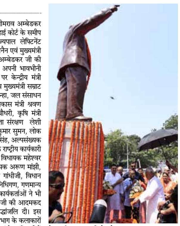
के कार्यक्रम प्रस्तुत किये गये।