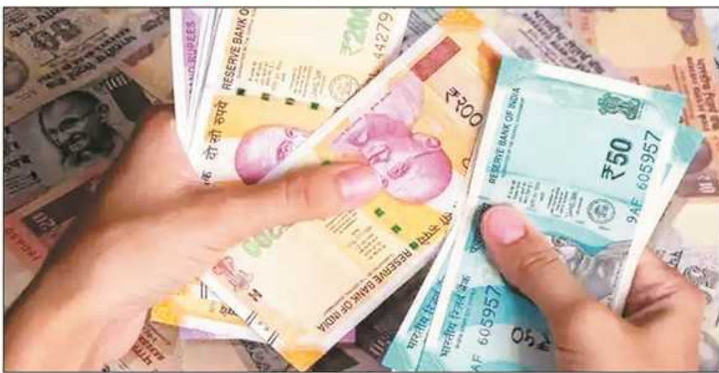
अब दोनों के अपने नफा-नुकसान हैं। हमने गोल्ड और ज्वैलरी अलग-अलग निवेश विकल्प हैं

निवेशकों को ज्यादा रिटर्न दिया। टाइटन ने जून 2011 में अपने शेयरधारकों को 1:1 के रेशियो में बोनस शेयर दिए। यानी, कंपनी ने हर 1 शेयर पर 1 बोनस शेयर दिया। साथ ही, टाइटन ने जून 2011 में ही 10:1 के रेशियो में अपने शेयर का बंटवारा (स्टॉक स्प्लिट) किया। बोनस शेयर और स्टॉक स्प्लिट जोड़ लें तो शेयरों की कुल संख्या 960 पहुंच जाती है। टाइटन के शेयर शुरुवार 10 अप्रैल 2026 को 4,505 रुपये पर बंद हुए हैं। इस हिसाब से 960 शेयरों की मौजूदा वैल्यू 44.86 लाख रुपये होती है।