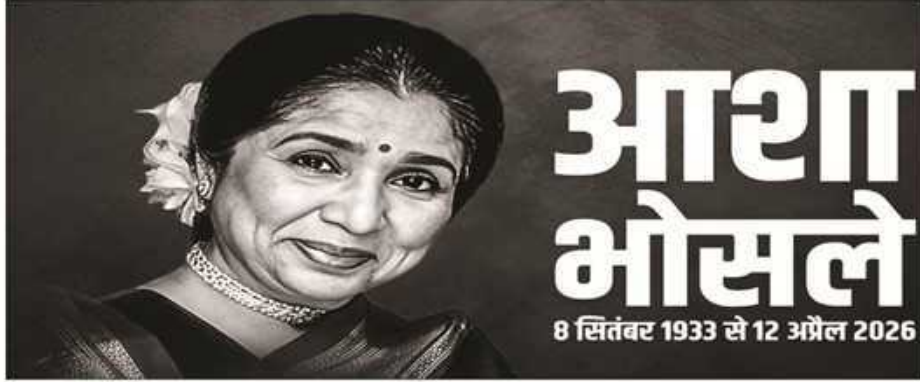
आशा भोसले 8 सितंबर 1933 से 12 अप्रैल 2026

एक प्रसिद्ध शास्त्रीय गायक थे, और घर का वातावरण शुरू से ही संगीत से परिपूर्ण था। ऐसे माहौल में पली-बढ़ी आशा ने बहुत कम उम्र में ही संगीत की दुनिया में कदम रखा। महज 10 साल की उम्र में उन्होंने अपना पहला मराठी गीत 'चला चला नव बाल' गाया था, जिसे उन्होंने अपनी बड़ी बहन लता मंगेशकर के साथ रिकॉर्ड किया। यह अनुभव उनके लिए प्रेरणादायक साबित हुआ, और यहीं से उनके जीवन की संगीत यात्रा ने दिशा पकड़ी। हालाँकि, आशा भोसले की जिंदगी का सफर आसान नहीं था। संगीतकार परिवार से आने और लता मंगेशकर जैसी महान गायिका की बहन होने के बावजूद उन्हें शुरूआती दौर में कड़ा संघर्ष करना पड़ा। उस समय लता मंगेशकर पहले से ही भारतीय फिल्म संगीत की रानी गायिका बन चुकी थीं, और उनकी छाया में आशा को अपनी अलग पहचान बनाने के लिए कड़ी मेहनत करनी पड़ी। उनकी आवाज शुरू में लता मंगेशकर से काफी