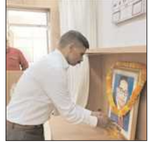
उनके विचारों को याद किया गया। आयुक्त कार्यालय सभागार में

जिलेभर में धूमधाम से मनाई गई डॉ. भीमराव अंबेडकर की 135वीं जयंती