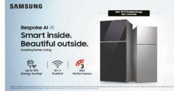
फाईकनेक्टिविटी के साथ आते हैं, ताकि इन्हें स्मार्टथिंग्स ऐप के जरिए स्मार्टफोन से आसानी से कंट्रोल और मॉनिटर किया जा सके। इन मॉडल्स में स्टाइलिश पलैट-डोर डिज़ाइन के साथ-साथ तुरंत कूलिंग के लिए पावर कूल

गुरुग्राम, एंजेंसी। भारत के सबसे बड़े कंज्यूमर इलेक्ट्रॉनिक्स ब्रांड सैमसंग ने अपने बीस्पोक एआई टॉप-माउंट फ्रीज़र रेफ्रिजरेटर्स लाइन-अप के विस्तार की घोषणा की है। यह नई रेंज भारतीय घरों में समझदारी भरी बिजली बचत और आधुनिक लुक लाने के लिए तैयार की गई है। शानदार बीस्पोक डिज़ाइन वाले इन रेफ्रिजरेटर्स में एडवांस एआई फ्रीचर्स, स्मार्ट कनेक्टिविटी और भरोसेमंद परफॉर्मंस का बेहतरीन मेल है। रेफ्रिजरेटर्स को इस नई रेंज में 256 लीटर और 236 लीटर की क्षमता वाले चुनिंदा मॉडल्स वाई-