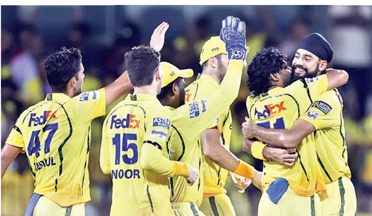
फॉर्म में लौटी चेन्नई सुपर किंग्स