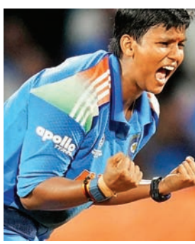
● 'फाइव क्रिकेटर्स ऑफ द ईयर' में गिल-जडेजा समेत 4 भारतीय; ऑस्ट्रेलिया के स्टार्क बेस्ट पुरुष खिलाड़ी

क्रिकेट की 'बाइबल' कही जाने वाली पत्रिका विजडन क्रिकेटर्स अल्मानैक ने इस साल ऑस्ट्रेलिया के मिचेल स्टार्क को 'लॉडिंग पुरुष क्रिकेटर' और भारत की दीप्ति शर्मा को 'लॉडिंग महिला क्रिकेटर' चुना। पत्रिका का 163वां संस्करण 15 अप्रैल को प्रकाशित होने जा रहा है। इस साल विजडन ने 'फाइव क्रिकेटर्स ऑफ द ईयर' में 4 भारतीय खिलाड़ियों को जगह दी। इनमें टीम इंडिया के कप्तान शुभमन गिल, रवींद्र जडेजा, ऋषभ पंत और मोहम्मद सिराज शामिल हैं। इन खिलाड़ियों ने पिछले साल इंग्लैंड के खिलाफ 2-2 से इंग्लैंड टेस्ट सीरीज में बेहतरीन प्रदर्शन किया था।