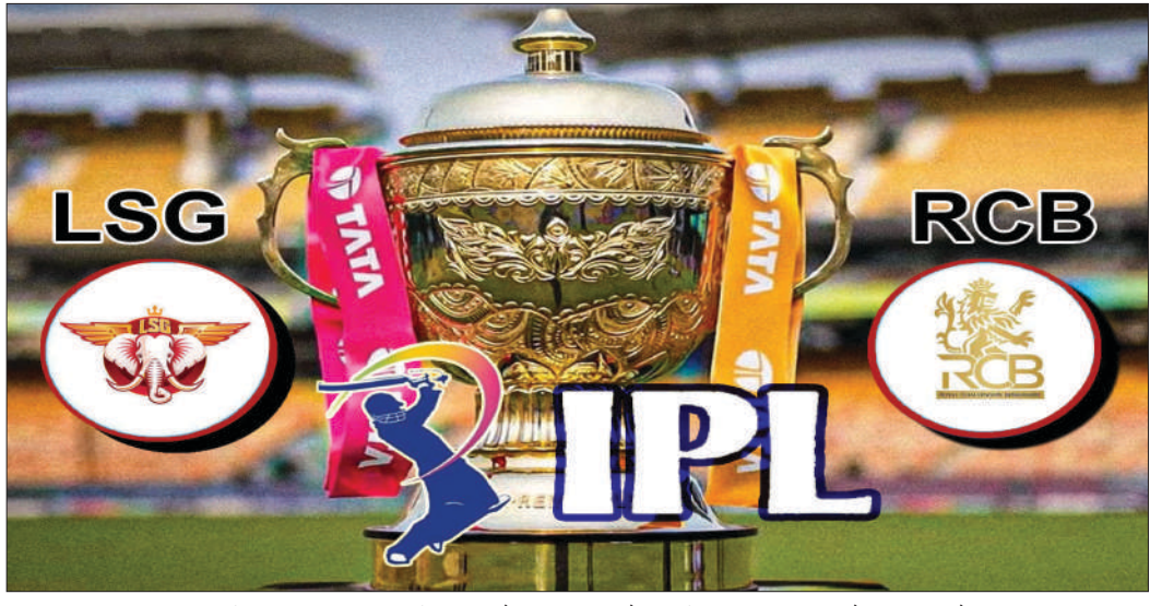
अपनी लय हासिल करना होगा। बेंगलुरु के मशहूर चित्रास्वामी स्टेडियम की पिच पर बड़े स्कोर बनते हैं। ऐसे में इस मैच में रोमांचक मुकाला होना तय है। अब तक दोनों टीमों के बीच 6 मैच खेले गये हैं जिसमें से आरसीबी ने 4 जबकि सुपर जायंट्स ने 2 जीते हैं।

बेंगलुरु (एजेन्सी)। (ईएमएस)। आईपीएल में बुधवार को रॉयल चैलेंजर्स बेंगलुरु (आरसीबी) का मुकाबला लखनऊ सुपर जायंट्स से होगा। इस मैच में जहां आरसीबी अपने घरेलू मैदान में जीत दर्ज करना चाहेगी। वहीं सुपरजायंट्स भी जीत के लिए पूरा प्रयास करेगी। आरसीबी का इस सत्र में काफी अच्छा प्रदर्शन रहा है। ऐसे में वह जीत की प्रबल दावेदार रहेगी। उसके पास विराट कोहली, फिल साल्ट, रजत पाटीदार और टिम डेविड जैसे अच्छे बल्लेबाज हैं। टीम ने अभी तक के मैचों में 200 से अधिक रन बनाये हैं। वह अंक तालिका में भी तीसरे स्थान पर है। वहीं दूसरी ओर, लखनऊ सुपर जायंट्स का अब तक का प्रदर्शन सामान्य रहा है। पिछले मैच में उसे गुजरात टाइटन्स के खिलाफ हार मिली थी। टीम के कप्तान ऋषभ पंत भी अब तक अच्छा प्रदर्शन नहीं कर पाये हैं। टीम में निरंतरता की भी कमी है। अब सुपर जायंट्स का लक्ष्य किसी भी प्रकार से ये मैच जीतकर