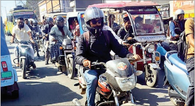
जाम की समस्या को और गंभीर बनाने वाला कारण दिन

है। बुधवार को रेड्मा चौक से लेकर ओवरब्रिज और कचहरी मोड़ तक लंबा जाम लग गया, जिससे आम लोगों का जनजीवन अस्त-व्यस्त हो गया। लोग करीब आधे घंटे से एक घंटे तक जाम में फंसे रहे। स्कूली बच्चे, कार्यालय जाने वाले कर्मचारी और व्यापारी सभी परेशान नजर आए। चिंताजनक बात यह है कि शहरी क्षेत्र में बड़ी संख्या में नाबालिग और कम उम्र के बच्चे भी दोपहिया वाहन चलाते देखे जा रहे हैं। इसके बावजूद यातायात व्यवस्था संभाल रहे पुलिसकर्मी इस ओर गंभीरता से ध्यान नहीं दे रहे हैं। नियमों की अनदेखी के कारण दुर्घटना की आशंका भी बनी हुई है।