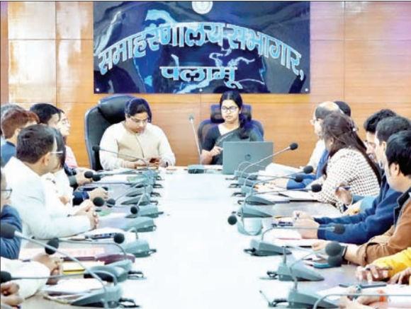
पोस्टल बैलेट, तथा मीडिया सर्टिफिकेशन एंड मॉनिटरिंग कमेटी (एमसीएमसी) से संबंधित जानकारी विस्तार से साझा की। प्रेक्षकों को बताया गया कि पलामू जिले के पांचों नगर निकायों में कुल 103 वार्डों के लिए चुनाव कराए जाएंगे, जिसके लिए 246 मतदान केंद्र बनाए गए हैं। साथ ही शस्त्रों का सत्यापन किया जा रहा है। निष्पक्ष