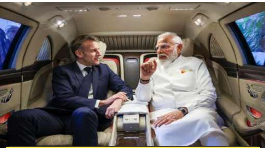
BEL-Safran Joint Venture Announced to Produce HAMMER Missiles in India

ture the H-125 helicopter in India — a platform capable of operating at extreme high altitudes, including conditions comparable to Mount Everest. He said the assembly line combines France's technological excellence with India's manufacturing scale, strengthening the 'Make in India' initiative. President Emmanuel Macron termed the India-France relationship "unique," built on trust, openness and shared ambition. He expressed confidence that cooperation between the two countries — especially in the Indo-Pacific, artificial intelligence and clean energy — will continue to expand. The two sides exchanged 21 agreements and outcome documents covering defence, energy, innovation, health and critical minerals. Key decisions include the