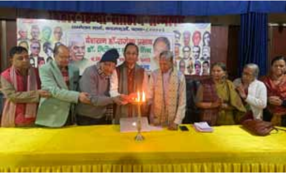
नई सोच एक्सप्रेस