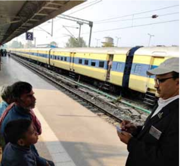
नई सोच एक्सप्रेस

समीक्षा कर आवश्यक संशोधन करने के निर्देश दिए गये हैं। उच्च जोखिम (HR) क्षेत्रों—ईंट भट्ठा, बस स्टैंड, रेलवे स्टेशन, फुटपाथ, झुग्गी-झोपड़ी, प्रवासी आबादी का विशेष फोकस करने को कहा गया है। जिले में कुल 508 टीम एवं 1213 मानव बल कार्य करेंगे। अभियान के दूसरे एवं तीसरे दिन घर घर टीम द्वारा X घरों के छूटे हुए बच्चों को टीका दिया जायेगा। प्रत्येक टीम को उचित सामग्री वैक्सिन, मार्कर, tally sheet उपलब्ध कराने का निर्देश दिया