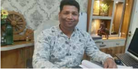
नई सोच एक्सप्रेस

अभिभावकों एवं स्थानीय नागरिकों की उपस्थिति रही। युवा उत्सव के अगले चरण में विभिन्न सांस्कृतिक एवं रचनात्मक प्रतियोगिताओं का आयोजन किया जाएगा।