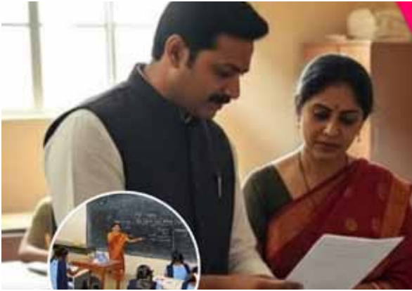
नई सोच एक्सप्रेस

कोई तकलीफ नहीं ,लेकिन जो भारत की देसी गाय है वह अपने बच्चों से इतना प्रेम करती है इतना लगाव करती है कि अगर उसके बच्चे को किसी ने बुरी नजर से देखा तो उस मार डालने के लिए तैयार हो जाती है। देसी गाय कि बच्चे सबसे बड़ी विशेषता है कि लाखों गाय के बीच अपने बच्चों को पहचान लेती है और लाखों की भीड़ में वह अपनी माँ को पहचान लेता है। जर्सी गाय कभी भी पैदल नहीं चल पाती, चलाने की कोशिश करो तो बैठ जाती है। लेकिन भारतीय गाय को यह विशेषता है उसे कितने भी चढ़ाव हो चढ़ती चली जाती है। यूरोप और अमेरिका के विशेषज्ञ वैज्ञानिक मानते हैं कि मानव के स्वास्थ्य पर प्रतिकूल प्रभाव डाल रही है। विदेशी क्रास ब्रीड नसलो से निजात पाना बड़ी समस्या है और इसके लिए मैं दशकों तक अच्छे साढ़ो के जरिए नसल सुधारने शुधारी करण अभियान चलाना होगा।