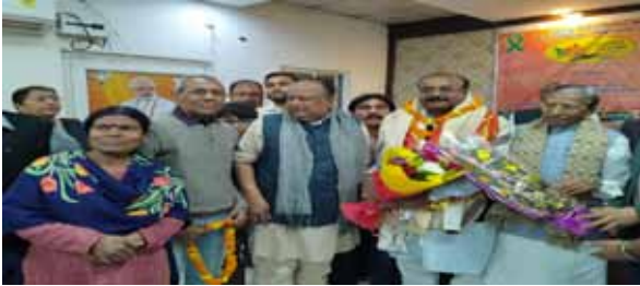
नई सोच एक्सप्रेस