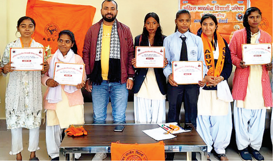
नवीन मेल संवाददाता