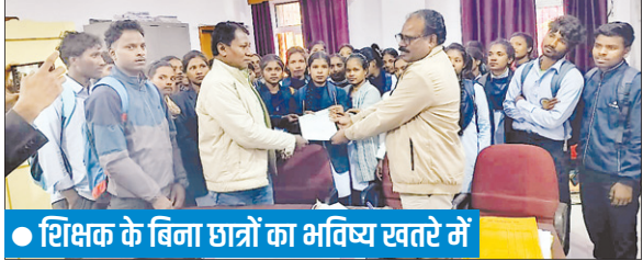
● शिक्षक के बिना छात्रों का भविष्य खतरे में

आदिवासी छात्र संघ केंद्रीय समिति ने डोरंडा कॉलेज के कुड़ुख विभाग में शिक्षकों की गंभीर कमी पर गहरी चिंता व्यक्त की। इस संबंध में बुधवार को रांची विश्वविद्यालय के डिप्टी रजिस्ट्रार को जापन सौंपा। जापन में बताया गया कि कुड़ुख विभाग में वर्तमान समय में एक भी शिक्षक कार्यरत नहीं है, जिसके कारण विभाग का शैक्षणिक कार्य पूरी तरह ठप है।