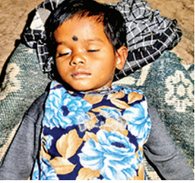
नवीन मेल संवाददाता