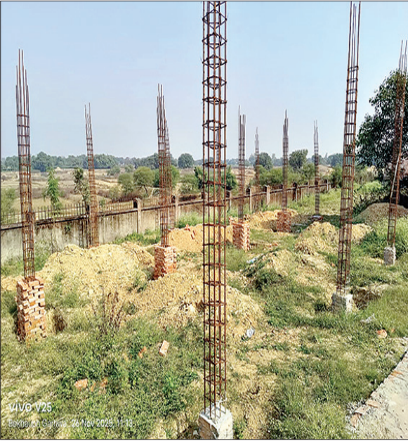
प्राथमिक उपचार, टीकाकरण, दवा वितरण और लैब परीक्षण जैसी

केतार। पाचाडुमर प्रखंड के प्राथमिक स्वास्थ्य केंद्र परिसर में 50 लाख रुपये की लागत से निर्माणाधीन ब्लॉक प्राइमरी हेल्थ यूनिट (बीपीएचयू) भवन का निर्माण कार्य शिलान्यास विवादों के कारण डेढ़ माह से ठप पड़ा है। संवेदक ने शिलान्यास किए बिना और जनप्रतिनिधियों को जानकारी दिए बिना कार्य शुरू किया था, जिससे स्थानीय जनप्रतिनिधि और झामुमो कार्यकर्ताओं ने नाराजगी व्यक्त करते हुए निर्माण रोक दिया। स्थानीय लोग कहते हैं कि भवन बनने पर क्षेत्रवासियों को ओपीडी सेवाएं, प्रसूति एवं मातृ स्वास्थ्य, आपातकालीन