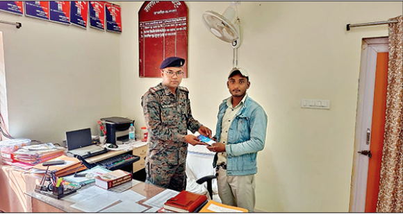
नवीन मेल संवाददाता

तकनीकी जांच से गुमशुदा मोबाइल मिला, थाना प्रभारी ने मालिक को लौटाया