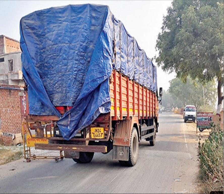
नवीन मेल संवाददाता

हुसैनाबाद। नगर पंचायत क्षेत्र के दातानगर के समीप जपला-हैदरनगर मुख्य मार्ग पर सुशीला अकादमी स्कूल के पास बना ऊंचा ब्रेकर लोगों के लिए दुर्घटना का कारण बनता जा रहा है। सोमवार की रात इसी अत्यधिक ऊंचे और खराब तरीके से बने ब्रेकर पर एक बाइक सवार नियंत्रण खो बैठा और पलट गया। हेलमेट पहनने के कारण