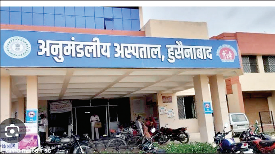
कराया गया है। अस्पताल अंतर्गत 5 पीएचसी और 25 आयुष्मान केंद्र

हुसैनाबाद। अनुमंडलीय अस्पताल हुसैनाबाद में चिकित्सकों की भारी कमी से मरीजों को परेशानी हो रही है। स्वीकृत 18 पदों के विरुद्ध केवल तीन चिकित्सक कार्यरत हैं। सबसे बड़ी समस्या यह है कि यहां एक भी महिला चिकित्सक तैनात नहीं है। गंभीर मरीजों को तत्काल मेदिनीनगर रेफर करना पड़ता है, जिससे कई की रास्ते में ही मौत हो जाती है। अस्पताल में बाल रोग विशेषज्ञ और स्त्री रोग विशेषज्ञ की आवश्यकता गहराई से महसूस की जा रही है। चालू वित्त वर्ष में अब तक 5484 मरीज पंजीकृत हुए हैं और 857 महिलाओं का सुरक्षित प्रसव