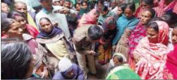
लोक तंत्र की आवाज