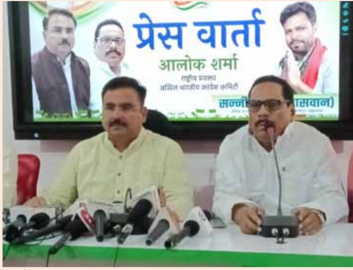
इस वैकसीन को बनाने वाली कंपनी ने भी भाजपा को जवाब देना चाहिए, वहीं जो हलफनामा दायर किया है उसे पर इलेक्शन कमिशन पर कांग्रेस ने निशाना