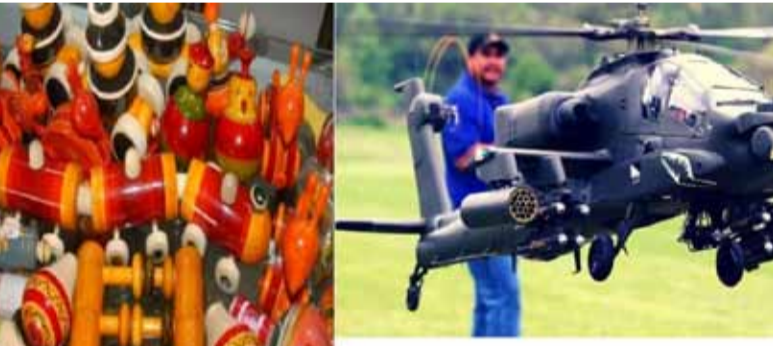
6 सबसे शानदार और शक्तिशाली खिलौने।

फतुहा। भारत का खिलौना निर्यात पांच - छ वर्षों में तेजी से बढ़कर 2600 करोड़ रुपए के स्तर पर पहुंच गया है। भारत से अमेरिका, ब्रिटेन, यूरोपीय यूनियन, ऑस्ट्रेलिया, यूएई, दक्षिण अफ्रीका सहित कई देशों को खिलौने निर्यात किया जा रहे हैं। भारतीय के खिलौना उद्योग का कारोबार करीब डेढ़ अरब रुपए डॉलर का है जो वैश्विक बाजार हिस्सेदारी का 0.5 फीसदी है लेकिन जिस तरह भारत में खिलौना उद्योग को प्रोत्साहन दिया जा रहा है उससे खिलौना उद्योग छलांग लगाते हुए तीन अरब डॉलर की ऊंचाई पर पहुंचने की संभावना रखता है स्पष्ट है कि दुनिया में भारतीय खिलौना बाजार को ऊंचाई मिलने की कई कारण हैं। मेक इन इंडिया अभियान में खिलौना निर्माण क्षेत्र भारत के लिए फायदे का सोदा साबित कर दिया है। गौरव है कि चीन से खिलौना खरीदारी करने वाले कई खरीदार अब तेजी से भारत की ओर कर रहे हैं, यह कुछ छोटी बात नहीं है, दुनिया में कोई एक दशक पहले खिलौने की भारत से किसी तरह की खरीदारी होती थी, लेकिन मेक इन इंडिया के कारण कई बड़ी-बड़ी खिलौना