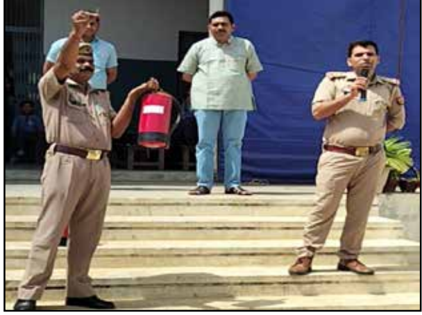
बचाव की जानकारियां दी मलिक के निर्देशन में टीम गई। एफएसएसओ विश्वास ने छात्रों को फायर ऑडिट,

संवाददाता संजीव शर्मा बालैनी। बाखरपुर बालैनी के दिल्ली नेशनल पब्लिक स्कूल में फायर ब्रिगेड टीम द्वारा छात्रों को भूकंप या आग जैसी आपदा आने पर बचने के तरीके बताए गए। टीम ने आग लगने पर विभाग को सूचित करने और अग्निशमन यंत्र के उपयोग करने की भी जानकारी दी।