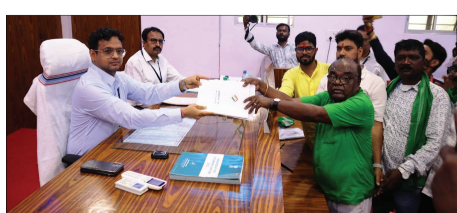
उज्ज्वल दुनिया संवाददाता