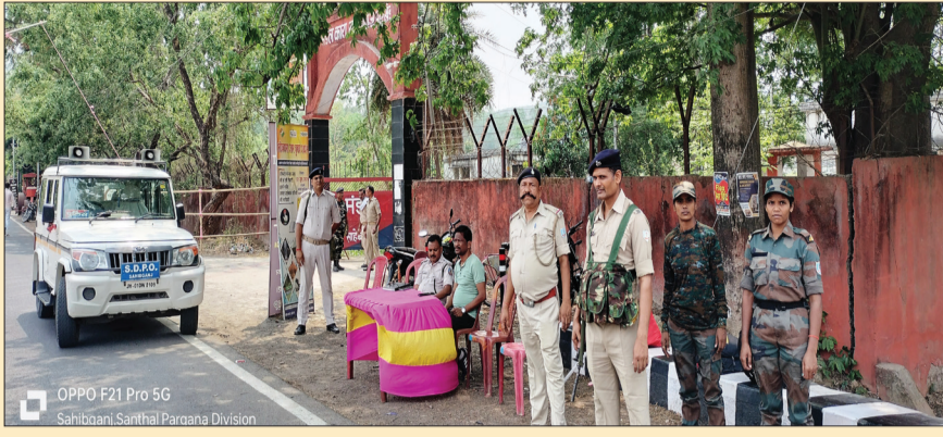
उज्ज्वल दुनिया संवाददाता