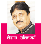
लेखक - ललित गर्ग