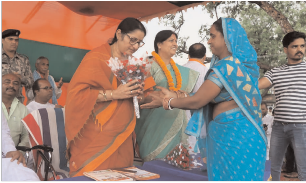
देती हैं। जनता सबकुछ देख और समझ रही है और इन्हें सबक सिखायेगी। मरकच्चो में जनसभा को संबोधित करने आई अन्नपूर्णा देवी ने पत्रकारों से बातचीत के दौरान ये बातें कहीं। अन्नपूर्णा देवी ने कहा कि कांग्रेस और उसके सहयोगी पूरे देश में छाप्टी पीट पीटकर कह रहे हैं कि मोदी सरकार केंद्रीय जांच एजेंसियों का दुरुपयोग कर रही है।

संवाददाता कोडरमा : केन्द्रीय शिक्षा राज्य मंत्री एवं कोडरमा संसदीय सीट से भाजपा प्रत्याशी अन्नपूर्णा देवी ने कहा कि प्रधानमंत्री नरेंद्र मोदी ने जब जनता का हक लूटकर अपनी तिजोरी भरनेवालों के खिलाफ सख्त कार्रवाई शुरू की तो पकड़े जाने के डर से सारे चोर इकट्ठे हो गए हैं और निराधार आरोपों से चौकीदार नरेंद्र मोदी पर हमले कर रहे हैं। झारखण्ड तो लूट का केंद्र बन गया है जहां कांग्रेस, झामुमो और राजद का मतलबपरस्त गठबंधन पिछले 5 साल से सत्ता में है। भाकपा माले जैसी पार्टियां लूट में हिस्सेदार बनने के लिए इस जनविरोधी सरकार का समर्थन कर रही हैं। अब जबकि जांच एजेंसियां अपना काम कर रही हैं तो इनके यहां से रह रहकर नोटों के पहाड़ मिल रहे हैं। रकम इतनी बड़ी होती है कि नोट गिनेवाली मशीनें जवाब दे