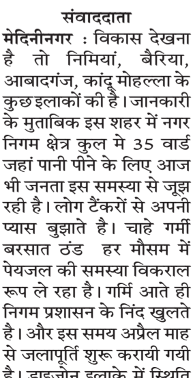
संवाददाता मेदिनीनगर : विकास देखना है तो निमियां, बैरिया, आबादागंज, कांदू मोहल्ला के कुछ इलाकों की है। जानकारी के मुताबिक इस शहर में नगर निगम क्षेत्र कुल में 35 वार्ड जहां पानी पीने के लिए आज भी जनता इस समस्या से जूझ रही है। लोग टैंकरों से अपनी प्यास बुझाते हैं। चाहे गर्मी बरसात टंड हर मौसम में पेयजल की समस्या विकराल रूप ले रहा है। गर्मि आते ही निगम प्रशासन के निंद खुलते हैं। और इस समय अप्रैल माह से जलापूर्ति शुरू करायी गयी है। द्राइजोन इलाके में स्थिति भयावह होने की वजह से लोगों की परेशानी अधिक बढ़ी है। इस इलाके में जब निगम का टैंकर पहुंचता है तो लोग पानी लेने के लिए दौड़ पड़ते हैं। कभी कभी तो पानी