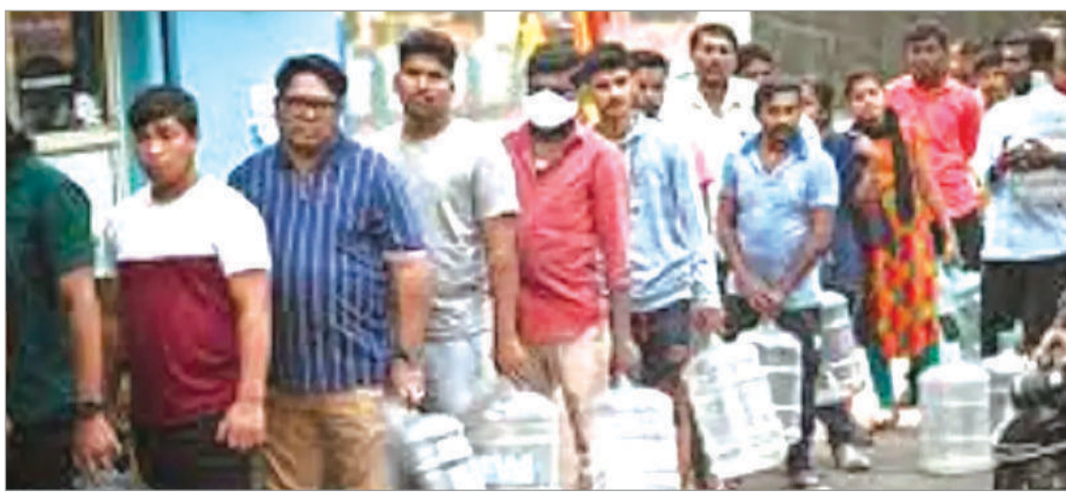
भरने के लिए आपस में लोग उलझ पड़ते हैं। इस वजह से लोगों की परेशानी कम नहीं हुई है। इधर गर्मी व धूप में बढ़ती होने के कारण पेयजल की समस्या गंभीर होती जा रही है। निगम सहित शहर के जन प्रतिनिधियों से लेकर जिला प्रशासन द्वारा इनकी पानी पीने के लिए आज तक काई टोस कदम नहीं उठाया है। पलामू कथित विकास के नाम पर जलापूर्ति योजना यहां वर्षों से फेल नजर आ रहे हैं। वहीं इस समय लोकसभा चुनाव में एक बार सरकार बनाने का दावा करती नजर आ रही है लेकिन इसकी जमीनी सच्चाई कुछ और ही व्या करती है। राज्य की राजनीतिक राजधानी के रूप में विख्यात पलामू और इसका मुख्यालय डालटनगंज

साढे चार वर्षों के कार्यकाल में जनप्रतिनिधि इस क्षेत्र में एक बार भी दर्शन भी नहीं हुए, चुनाव तो जीत गए, परंतु उन्हें पानी की समस्या से कोई मतलब नहीं रहा। यही वजह है कि क्षेत्र की बदहाली से उन्हें कोई लेना-देना नहीं रह गया है। लोगों का कहना है कि जनप्रतिनिधि का कभी कभार इस क्षेत्र में भूलवश आगमन हो जाता भी है, तो वह लम्जरी गाड़ियों के साथ आते हैं। उन्हें क्या मालूम शहर में पानी पीने के लिए पेयजल की समस्या क्षेत्र में गंभीर रूप ले चुका है, परंतु इससे कोई लेना देना नहीं, शहर वासियों ने बताया कि इस बार के चुनाव में झूठे दावे का पोल यहां की जनता खोलेली। और ऐसे प्रत्याशी को यहां की जनता मुहतोड़ जवाब देने के लिए तैयार है।