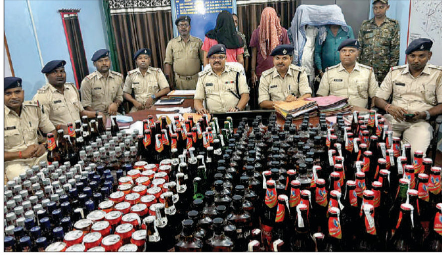
रूप से शराब की बिक्री चोरी छुपे करते हुए लोगों की सूचना थी पुलिस को मिल रही थी। इस