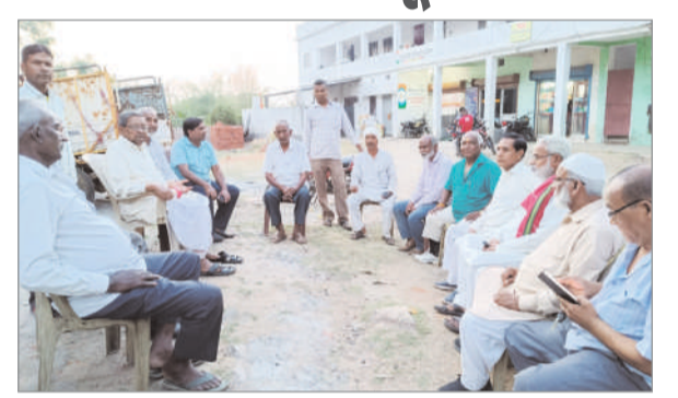
आज तक दो लोगों का भी नौकरी देने का काम नहीं किया। झारखंड राज्य गठन होने के बाद भाजपा की सरकार बनी। जिसके मुख्यमंत्री बाबूलाल मरांडी थे। जो दलितों पिछड़ों की आरक्षण को काम कर दिया। पिछड़ों की आरक्षण 27% था जिसे घटकर 14% कर दिया गया। दलितों का 14% था जिसे 9% कर दिया गया और आज भाजपा कर रही है कि कांग्रेस