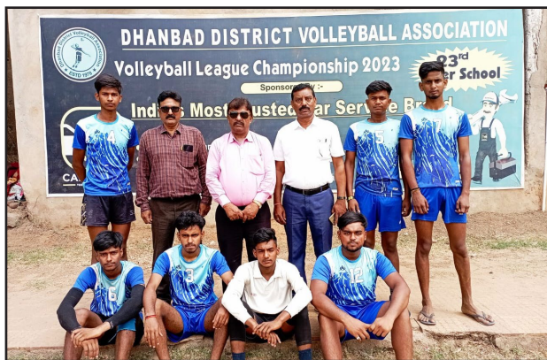
डी ए वी अलकुशा

ऑफ नॉलेज, बड्स गार्डन राजगंज नॉकआउट स्टेज के सेमी फाइनल में पहुंचा वही आज खेले गए अंडर 14 लीग मैच का परिणाम इस प्रकार है स्वरूप सरस्वती विद्या मंदिर टुंडी ने आईएसएल को 1510, 1511 से मिशन ऑफ नॉलेज ने धनबाद सिटी स्कूल भूली 15 11 15 10 से बड्स गार्डन राजगंज ने राजकमल धनबाद को 1510 1215 1614 से स्वरूप सरस्वती