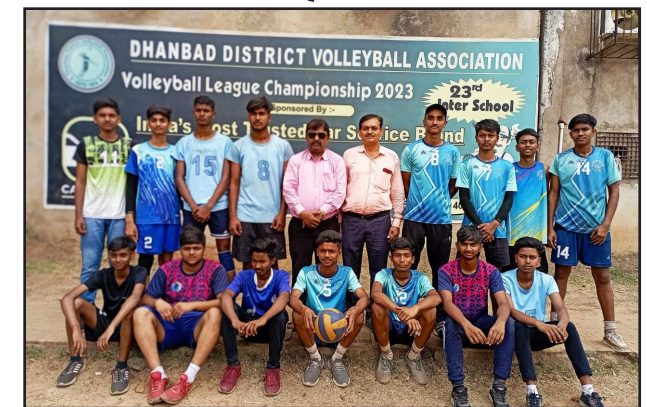
डी ए वी मॉडल

ऑफ नॉलेज, बड्स गार्डन राजगंज नॉकआउट स्टेज के सेमी फाइनल में पहुंचा वही आज खेले गए अंडर 14 लीग मैच का परिणाम इस प्रकार है स्वरूप सरस्वती विद्या मंदिर टुंडी ने आईएसएल को 1510, 1511 से मिशन ऑफ नॉलेज ने धनबाद सिटी स्कूल भूली 15 11 15 10 से बड्स गार्डन राजगंज ने राजकमल धनबाद को 1510 1215 1614 से स्वरूप सरस्वती