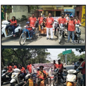
पोलिट लाइव रिपोर्टर