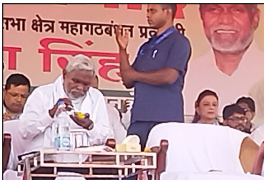
सीएम मिठाई खाते