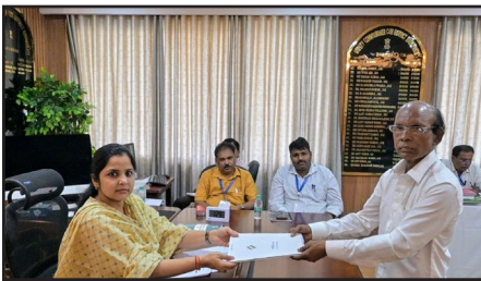
पोलिट लाइव रिपोर्टर