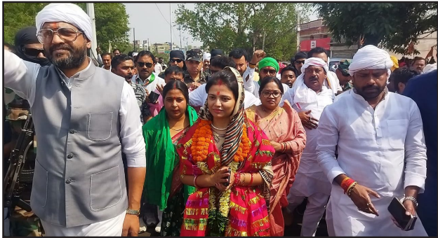
पोलिट लाइव रिपोर्टर