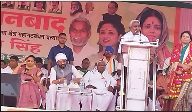
सीएम चंपाई सोरेन सम्बोधन करते

10 वर्षों में केंद्र की सरकार ने सिर्फ झूठे वादे किए, जनता अब बदलाव चाहती : मुख्यमंत्री चंपाई सोरेन