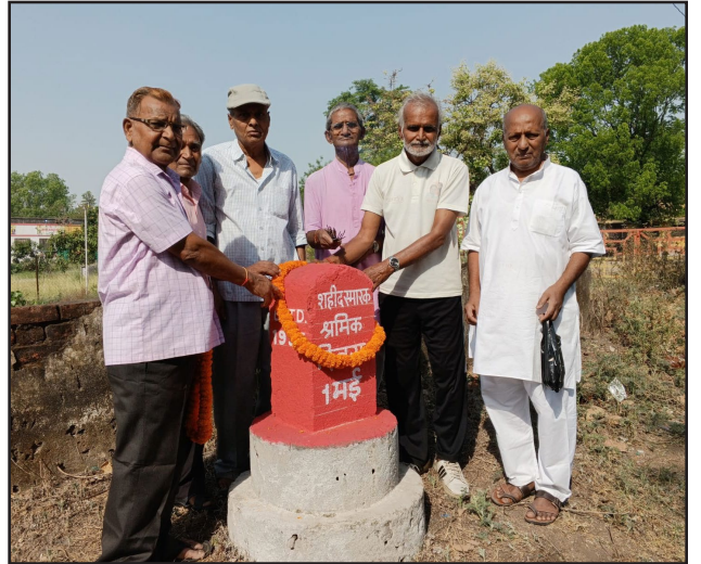
पोलिट लाइव रिपोर्टर

सिंदरी: अंतर्राष्ट्रीय मजदूर दिवस के अवसर पर सिंदरी के विभिन्न मजदूर संगठनों द्वारा विभिन्न जगहों पर कार्यक्रम आयोजित कर शिकागो के अमर शहिद को श्रद्धांजलि