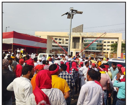
समरणालय के बाहर समर्थकों की भीड़

■ लोग एनडीए और प्रधानमंत्री नरेंद्र मोदी के झूठे वादों से ऊब चुकी है।