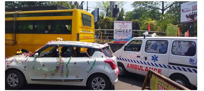
रोड शो के भीड़ में फंसी स्कूल बस, एम्बुलेंस, बाराती गाडी में बेचारा दूल्हा