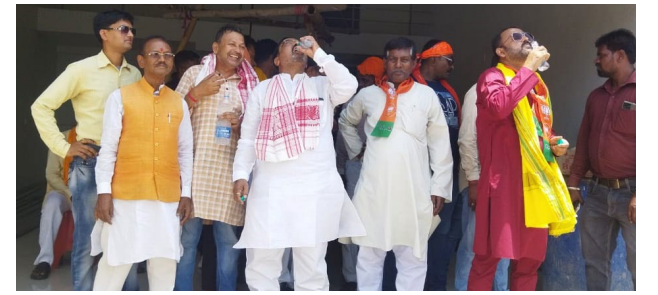
गर्मों से परेशान नेताजी