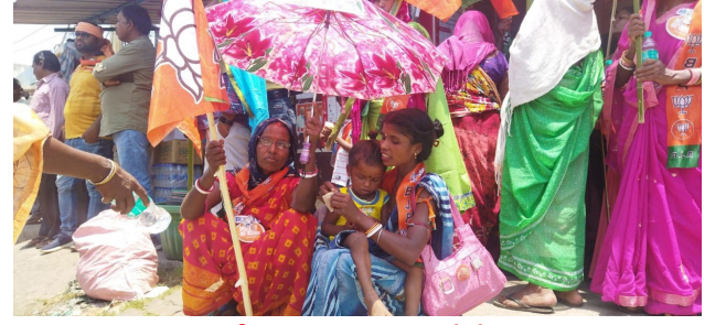
महिलाये ज्यादा संख्या में पहुंची थी,